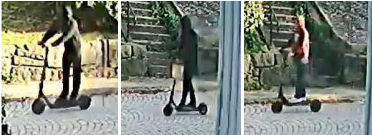
Bilder från förundersökningsprotokollet, aktbilaga 680, s. 290-292 (Brobacken Lerum)

Personen med vit skjorta och sparkcykel, som har påståtts vara Jaser Abou Bakr, placerar sig i hörnet av det blå huset klockan 18:14. Några sekunder senare lämnar han hörnet och åker, tillsammans med den person som har påståtts vara Osama Seriyeh, ner åt vänster mot vändplatsen. Därefter försvinner de båda ur bild.