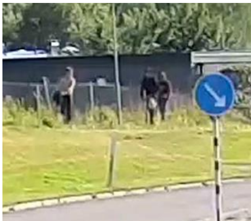
Bild från förundersökningsprotokollet, aktbilaga 682, s. 13 (Hulan – från Shell bensinstation)

En stund senare, klockan 17:48, kommer ytterligare tre personer åkandes på varsin sparkcykel i riktning mot Lerums centrum. Två av personerna är svartklädda och en har bar överkropp eller ljus överdel. Den ena av de svartklädda personerna ser ut att ha något föremål på styret.