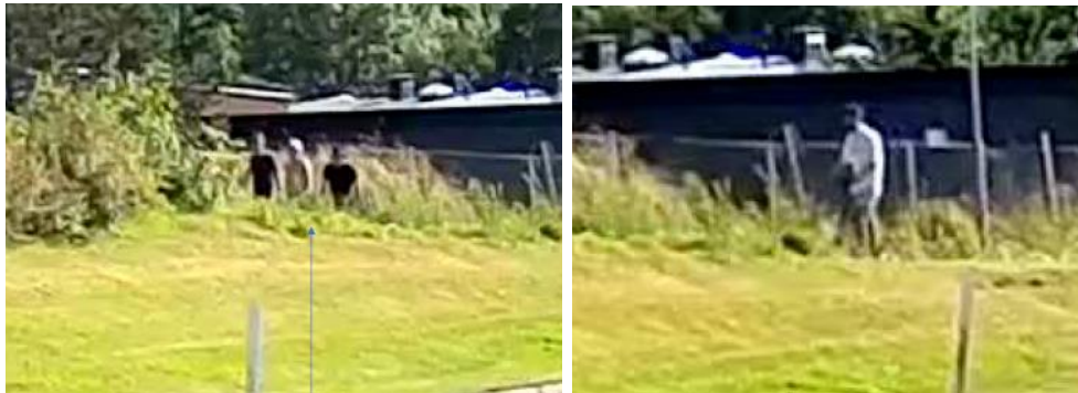
Bilder från förundersökningsprotokollet, aktbilaga 682, s. 11 och 12 (Hulan – från Shell bensinstation)

I utredningen finns en övervakningsfilm från bensinstationen Shell vid Hulanområdet i Lerum. Klockan 17:23 kommer tre personer, två svartklädda och en med bar överkropp eller ljus överdel, gåendes från det håll där ICA Kvantum i Hulan ligger. Sällskapet rör sig i riktning mot Lerums centrum. Klockan 17:29 åker en person med vit överdel på en sparkcykel åt samma håll.