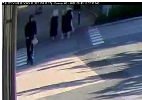
Bilder från förundersökningsprotokollet, aktbilaga 680, s. 261 och 264 (Lerums station)

Klockan 18:02 registrerades ett kortköp med Dan Schürer von Waldheims kort på Gula kiosken i centrala Lerum.