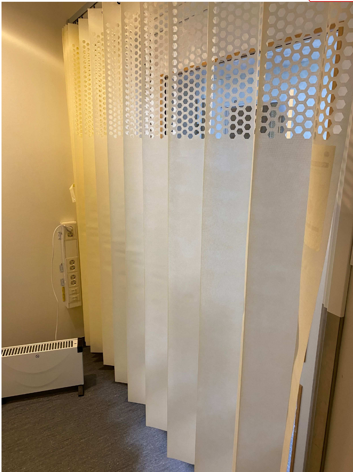
13. Bild över rum 35 på akutmottagningen i Lund.