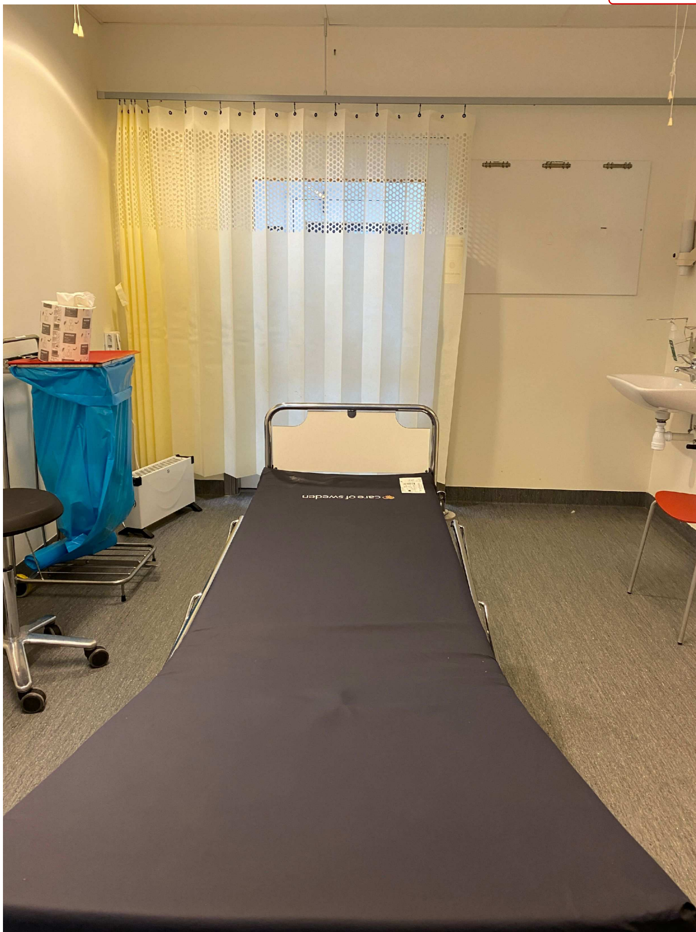
9. Bild över rum 35 på akutmottagningen i Lund.