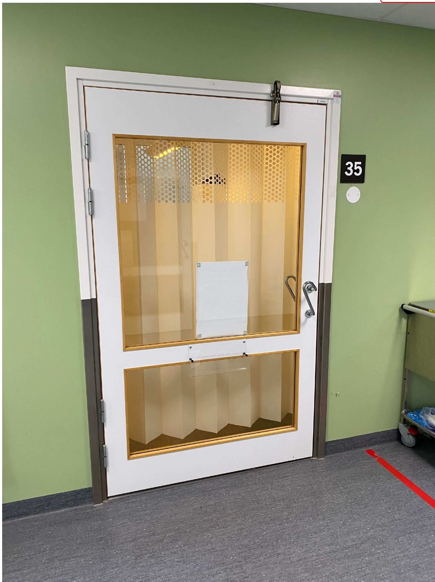
3. Bild över rum 35 på akutmottagningen i Lund.