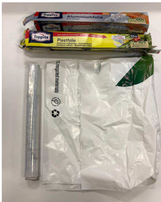
Bild 9. Foto från beslagsmiljö, ur den blå kassen. Förpackningsmaterial såsom plastfolie och aluminiumfolie.