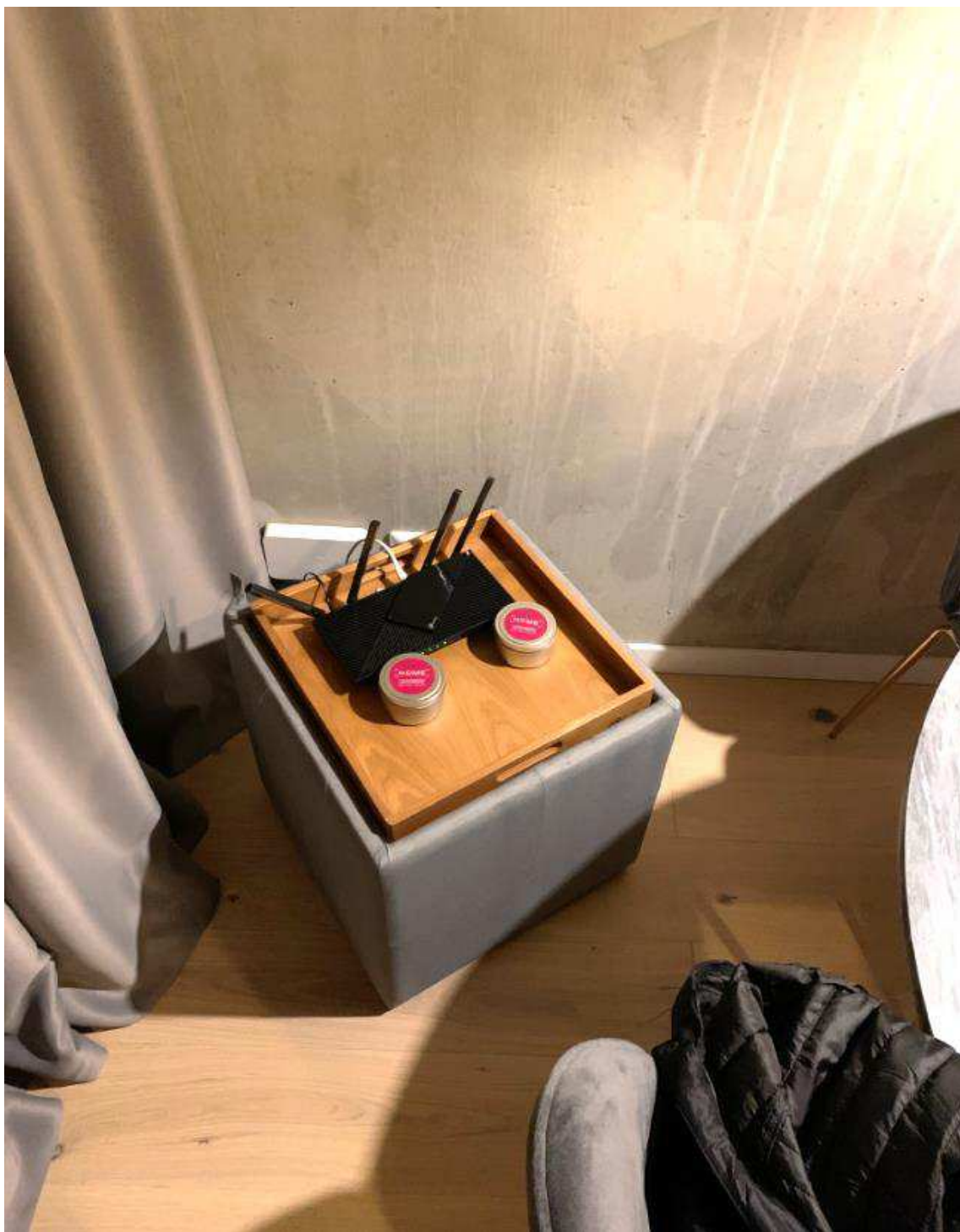
Bild 2. Låda/fotpall med wifi-router på locket. Lådan stod längst in till höger i allrummet, bortanför matgruppen invid gardinerna mot fönsterpartiet.