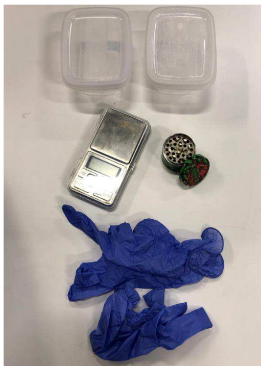
Bild 10. Ytterligare innehåll från den blå kassen; engångshandskar, våg, burkar och en s.k grinder.