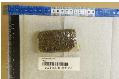
Bild 3. BG123999-1

Materialet bestod av en plastförpackning innehållande misstänkt drog, se bild 3.