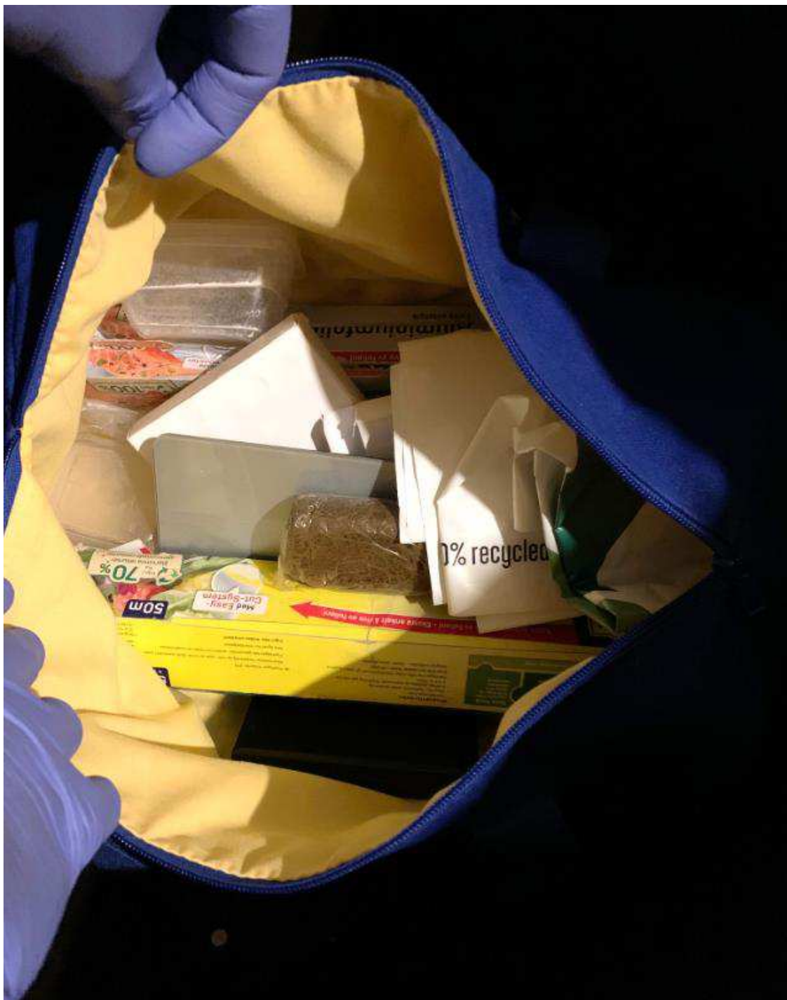
Bild 6. När väskan öppnas syns haschkaka, BG123999-1. I väskan anträffades även vågar, förpackningsmaterial, engångshandskar och drogtester.