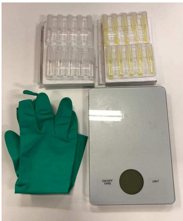
Bild 11. Ytterligare innehåll från den blå kassen, engångshandskar, drogtester och en våg till.