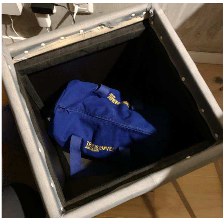
Bild 4. Tygväskan fullt synlig.