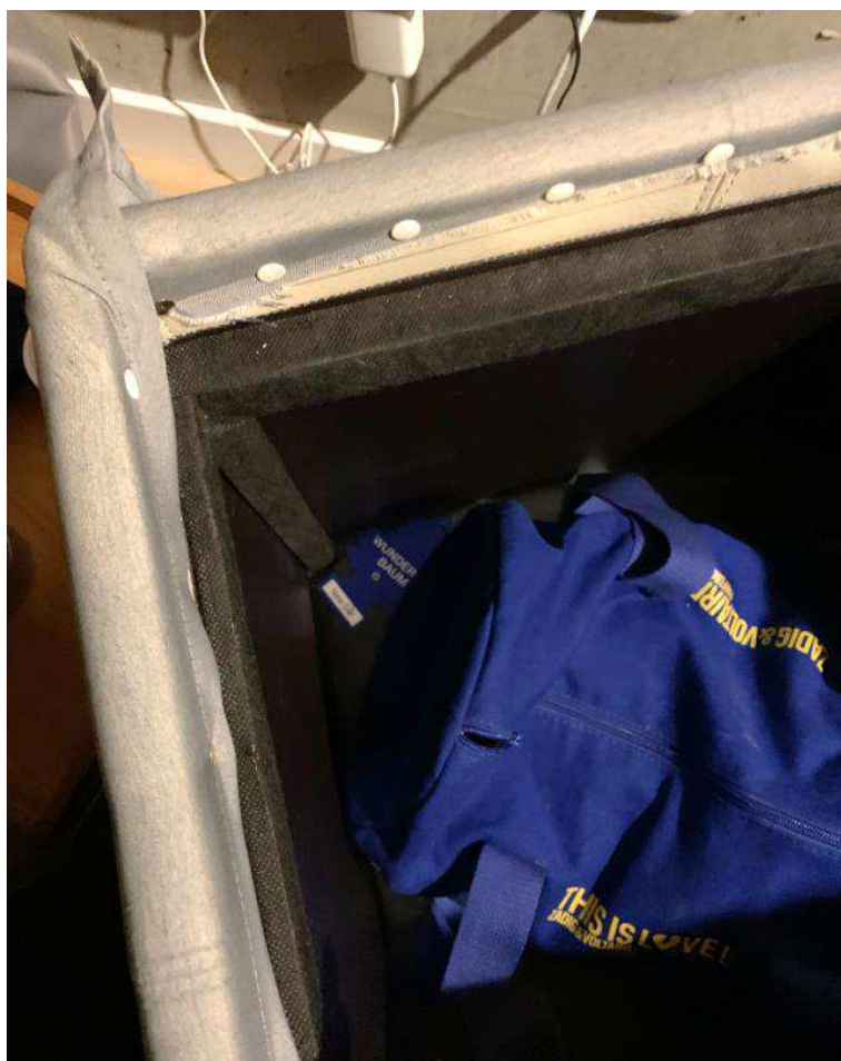
Bild 5. Invid tygväskan, på lådans botten, låg det flera Wunderbaum doftgranar.