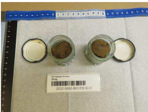
Bild 5. BG123999-3

Materialet bestod av två glasburkar (innehöll misstänkt drog), se bild 5.