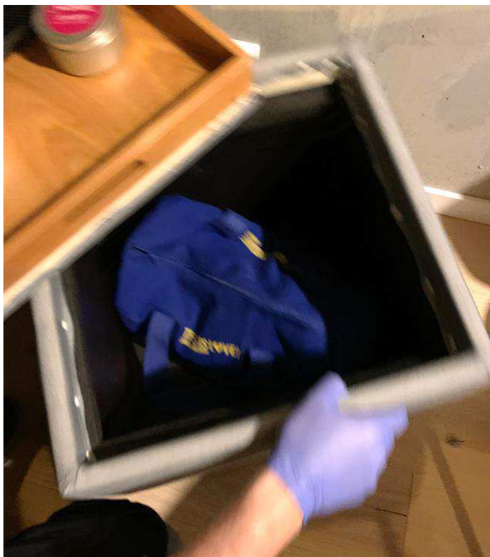
Bild 3. I lådan låg en blå tygväska som i ärendet fick beslagsnummer BG123999-4.