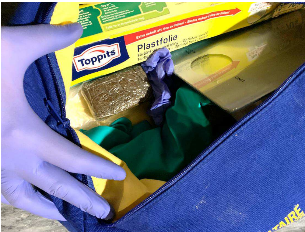
Bild 7. Ytterligare en haschkaka antr i samma blå väska. Här skymtar även grön diskhandske. Se nästa bild.