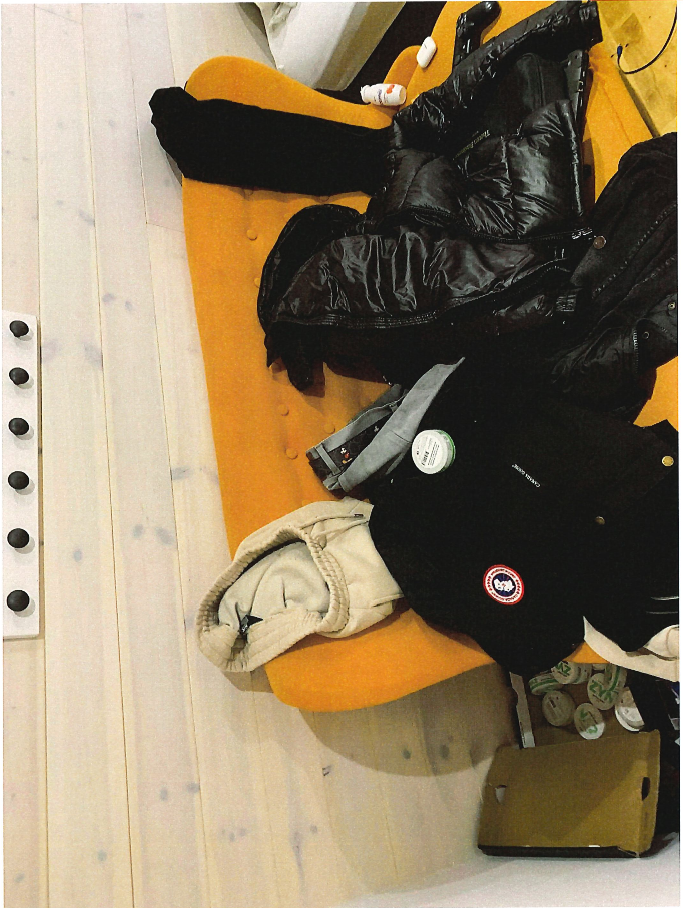
2. Sofa m kläder