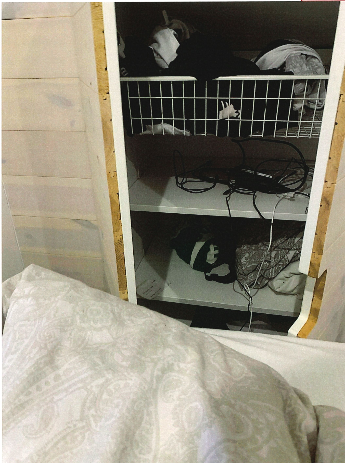
5. Garderob 2