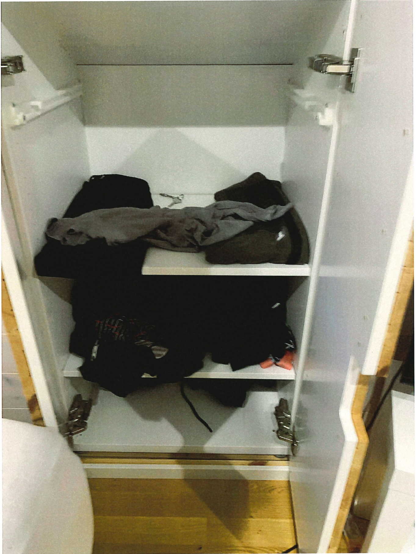
4. Garderob 1