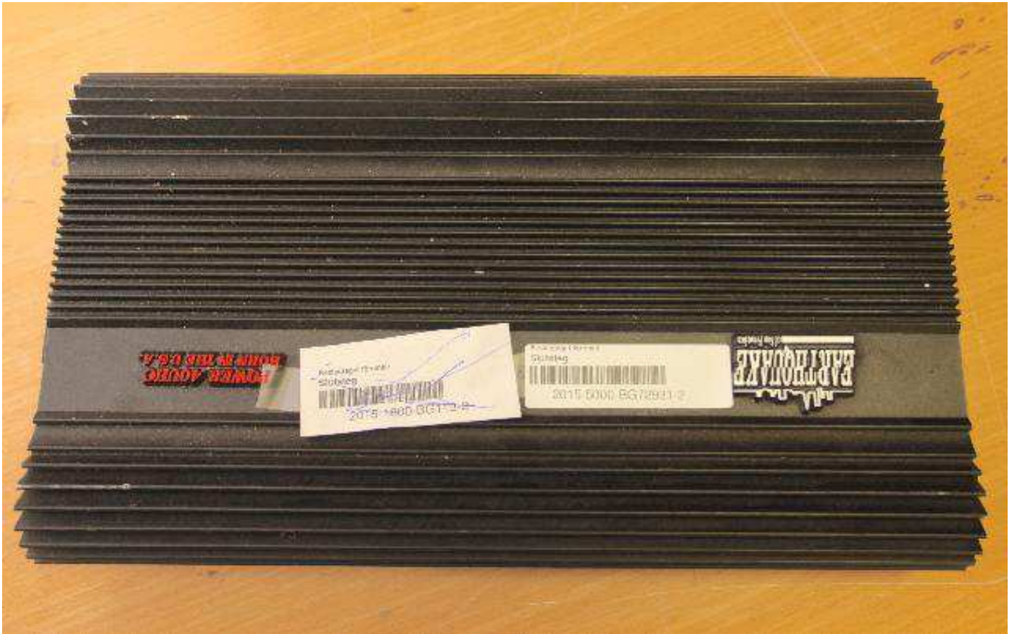
Fotografier på beslag 2015-5000-BG72931-2