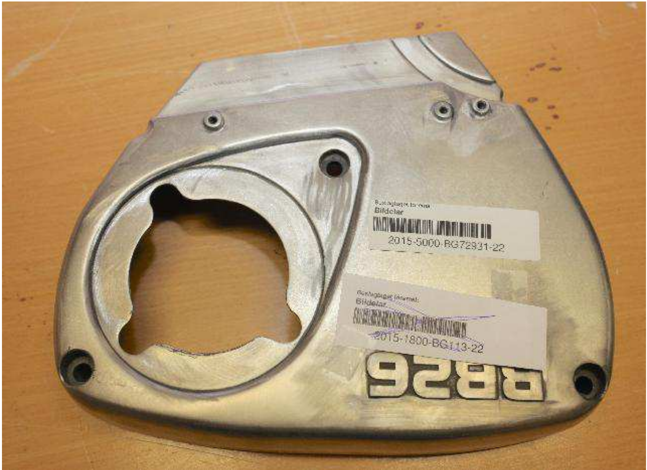
Fotografier på beslag 2015-5000-BG72931-22