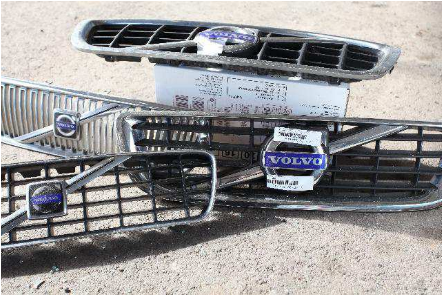
Fotografier på beslag 2015-5000-BG72931-6