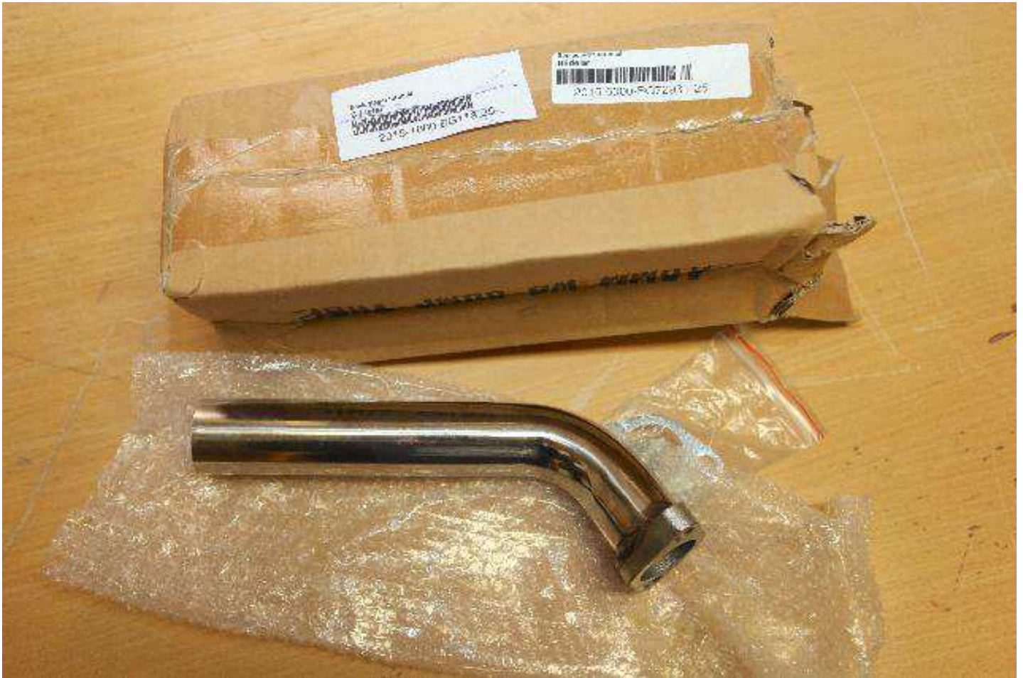
Fotografier på beslag 2015-5000-BG72931-25