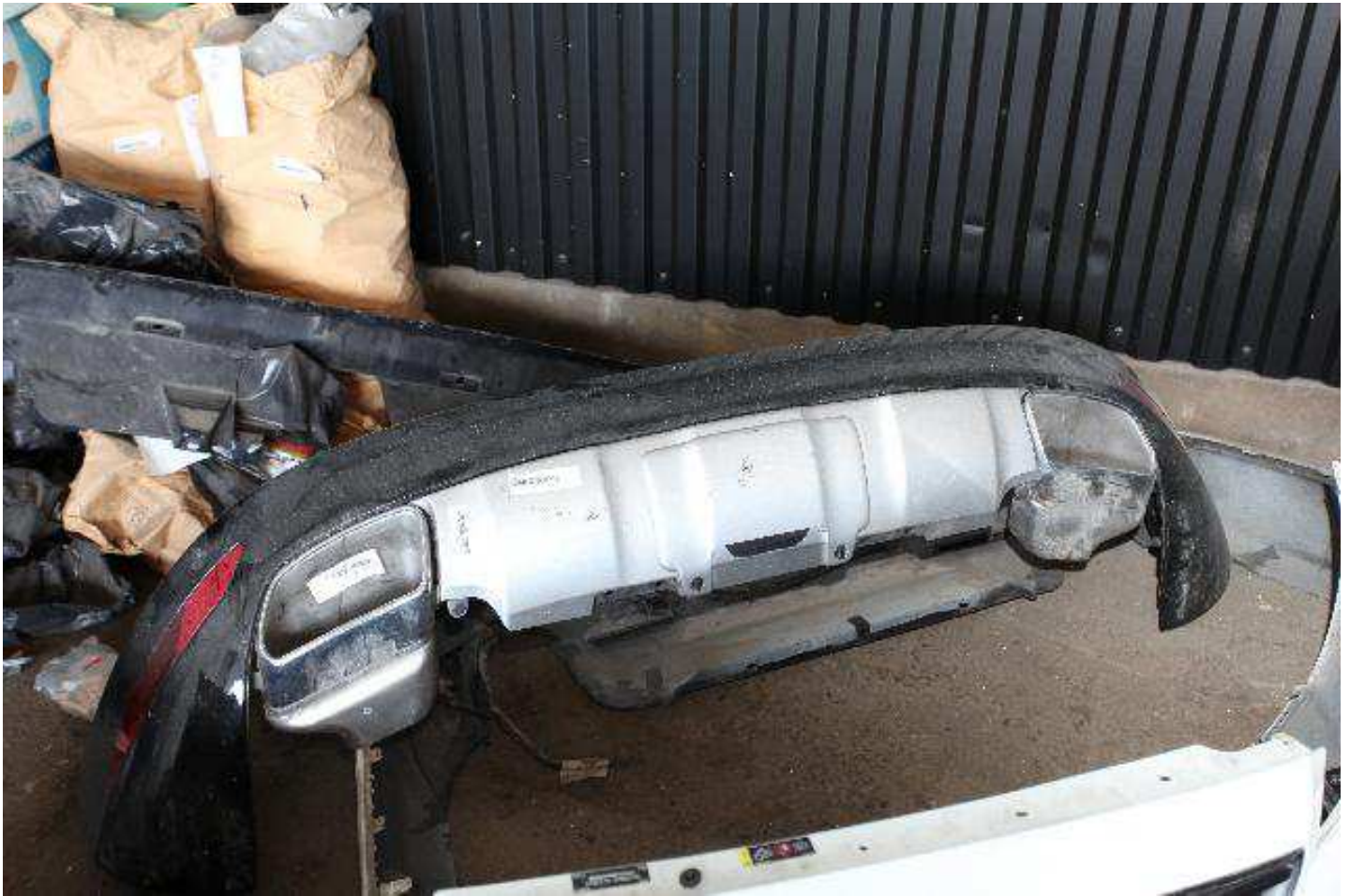
Fotografier på beslag 2015-5000-BG72931-9