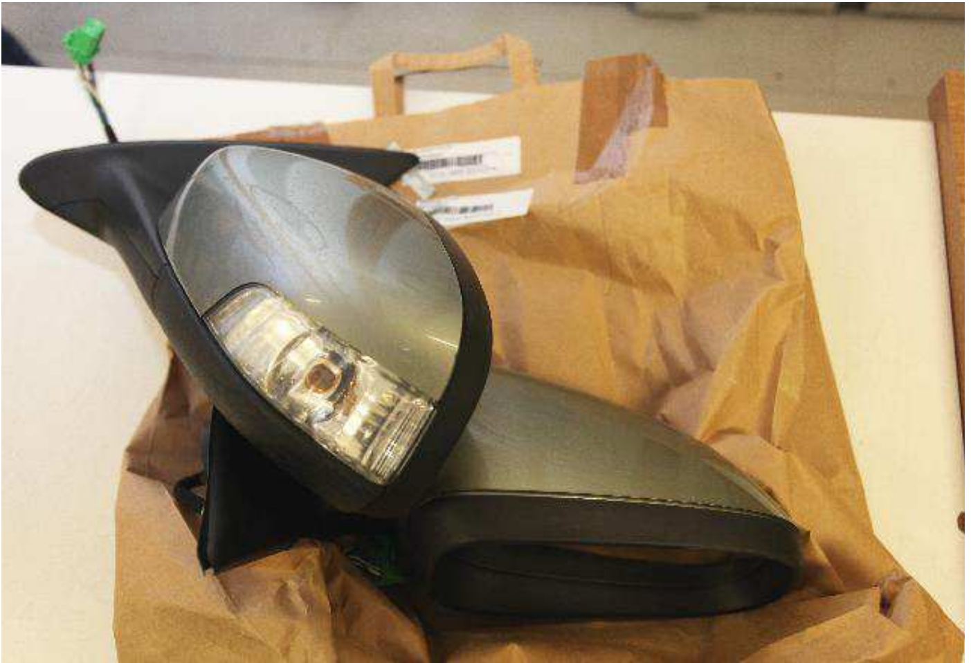
Fotografier på beslag 2015-5000-BG72182-4