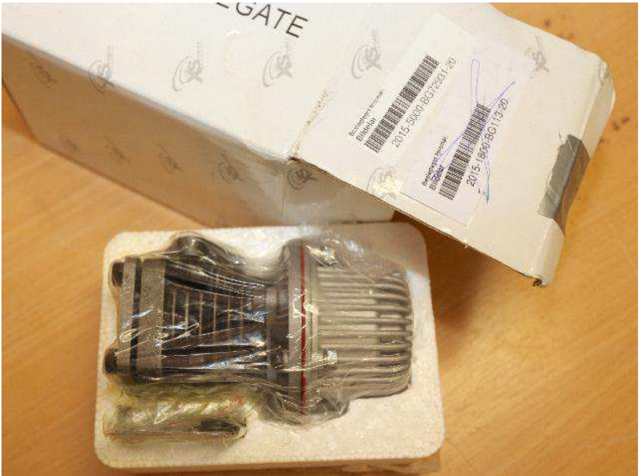
Fotografier på beslag 2015-5000-BG72931-20