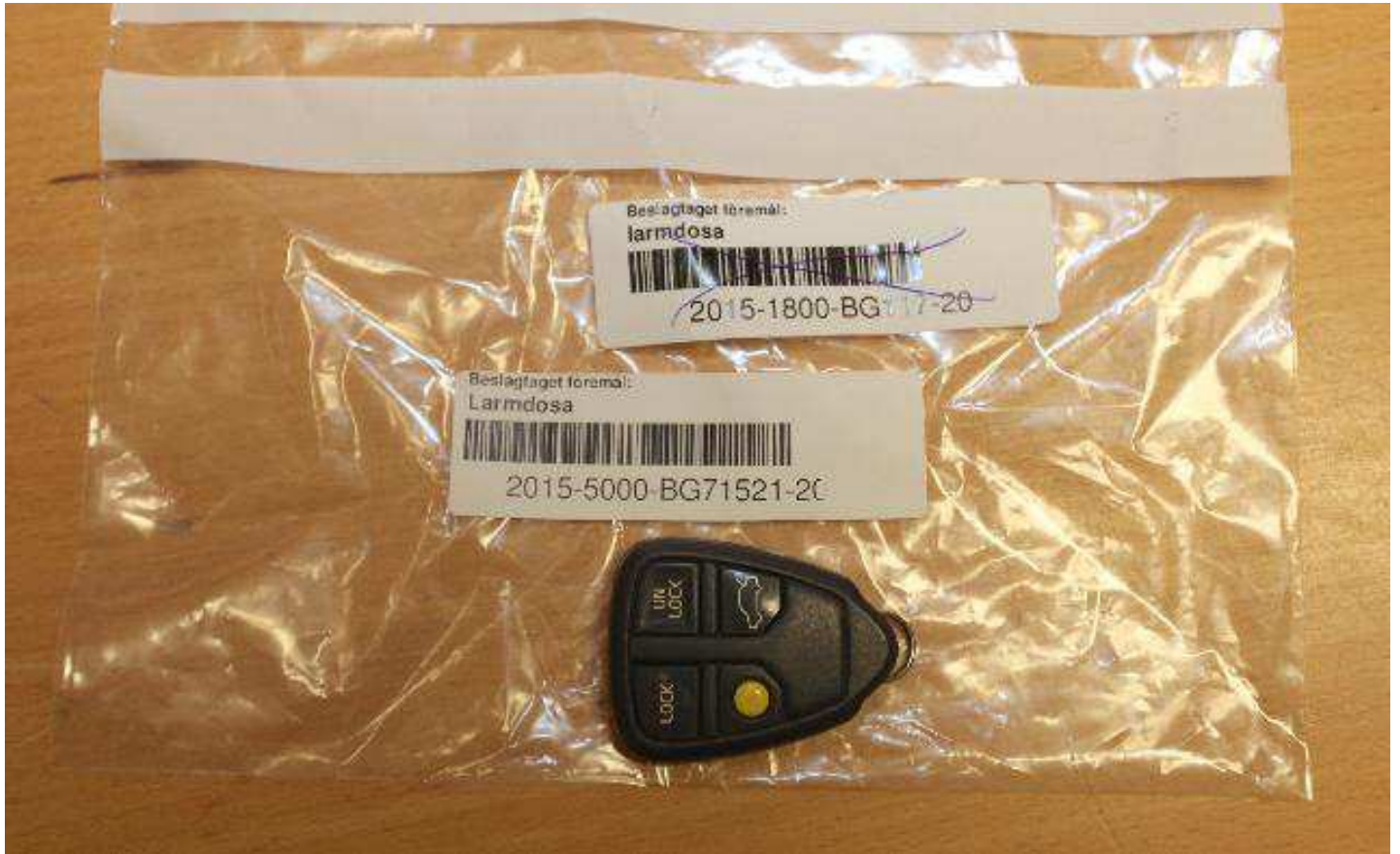
Fotografier på beslag 2015-5000_BG71521-20