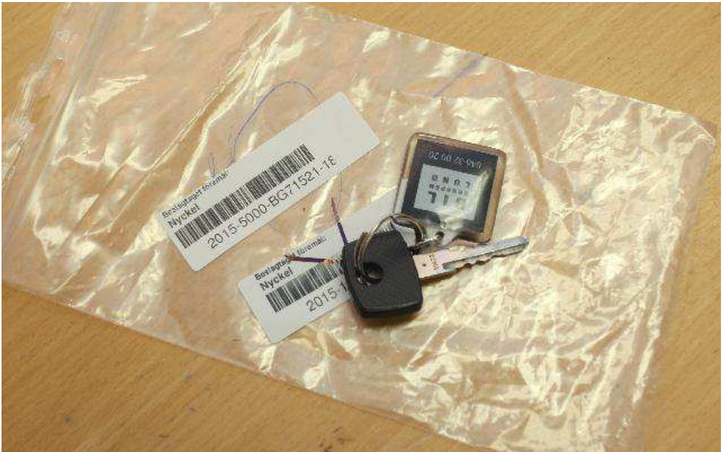
Fotografier på beslag 2015-5000_BG71521-18