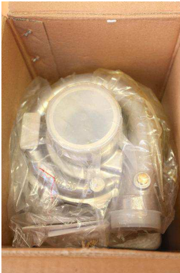
Fotografier på beslag 2015-5000-BG72931-18