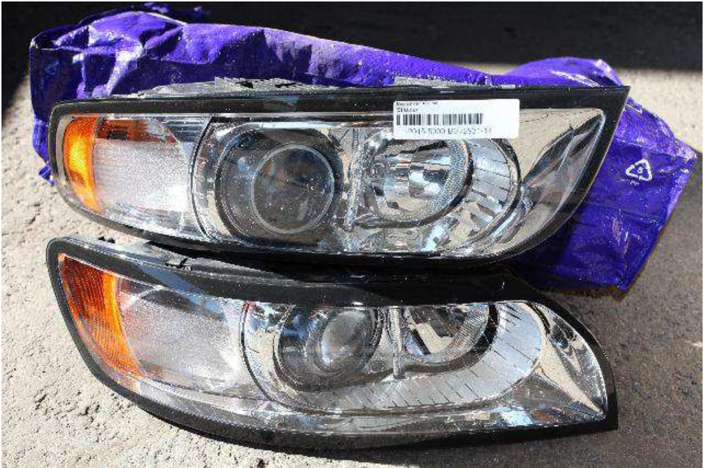
Fotografier på beslag 2015-5000-BG72931-14