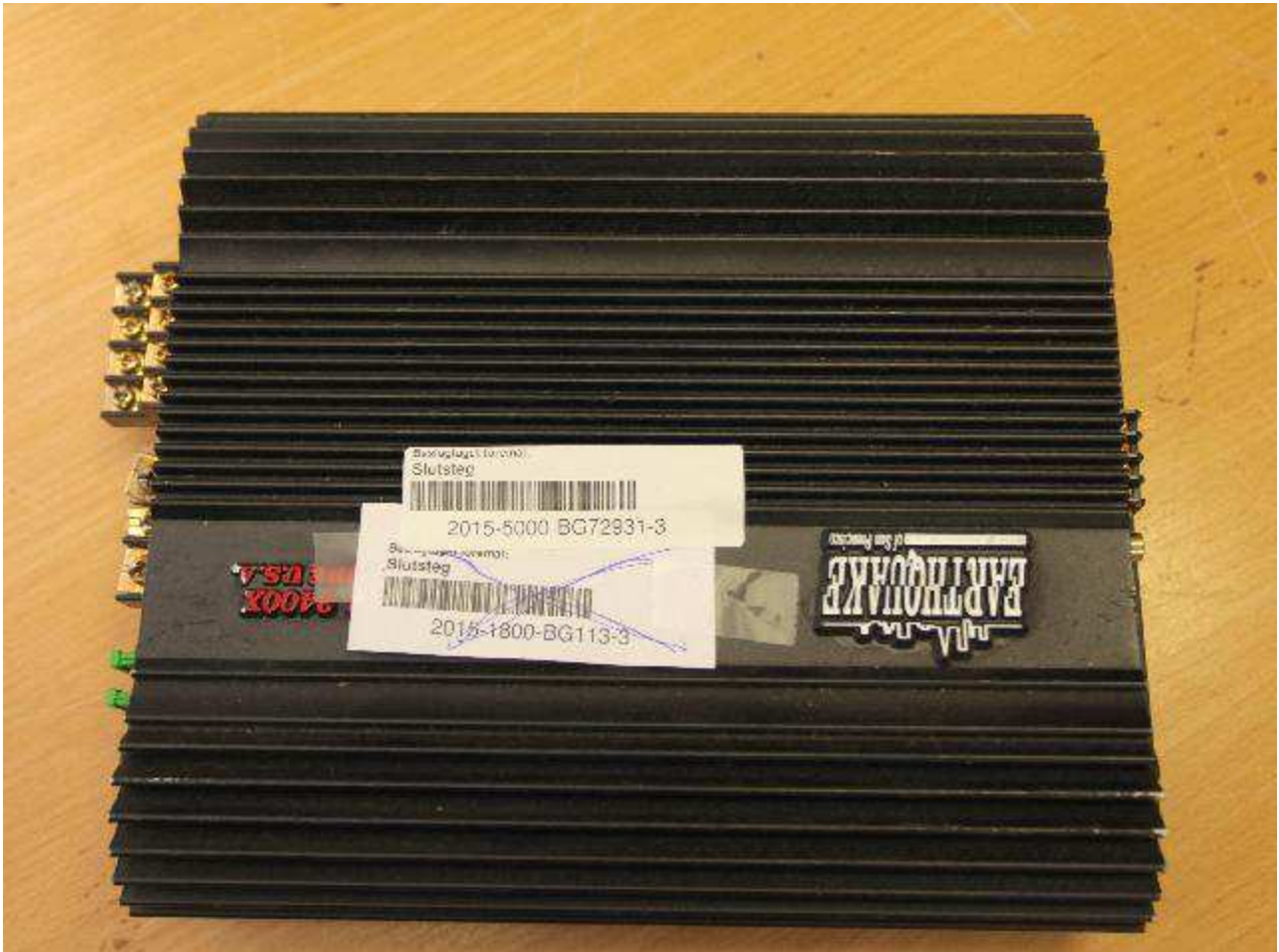
Fotografier på beslag 2015-5000-BG72931-3