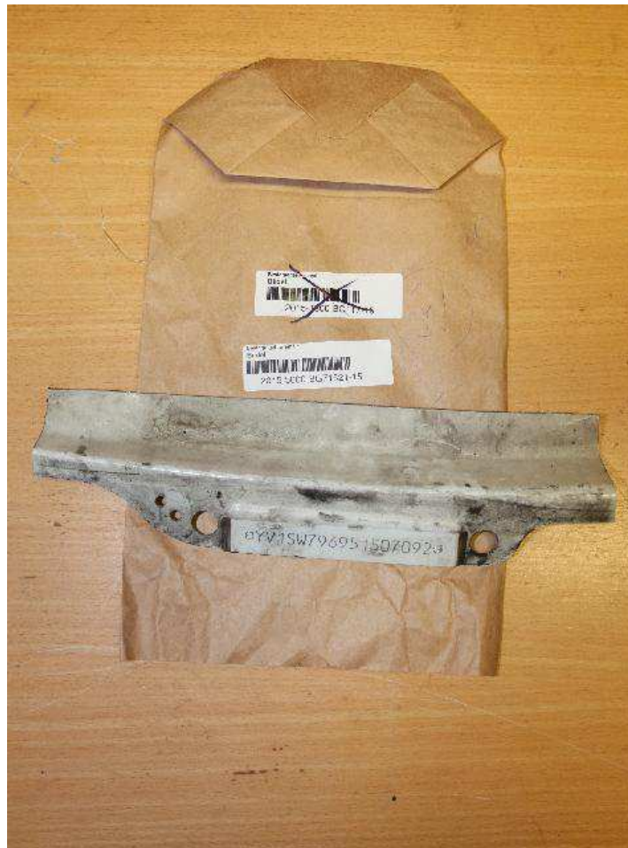
Fotografier på beslag 2015-5000_BG71521-15