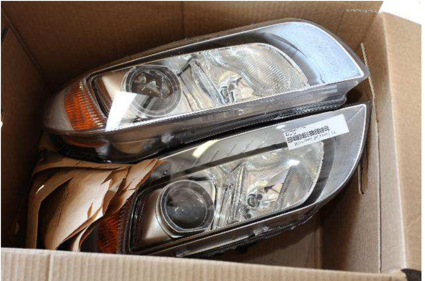
Fotografier på beslag 2015-5000-BG72931-15