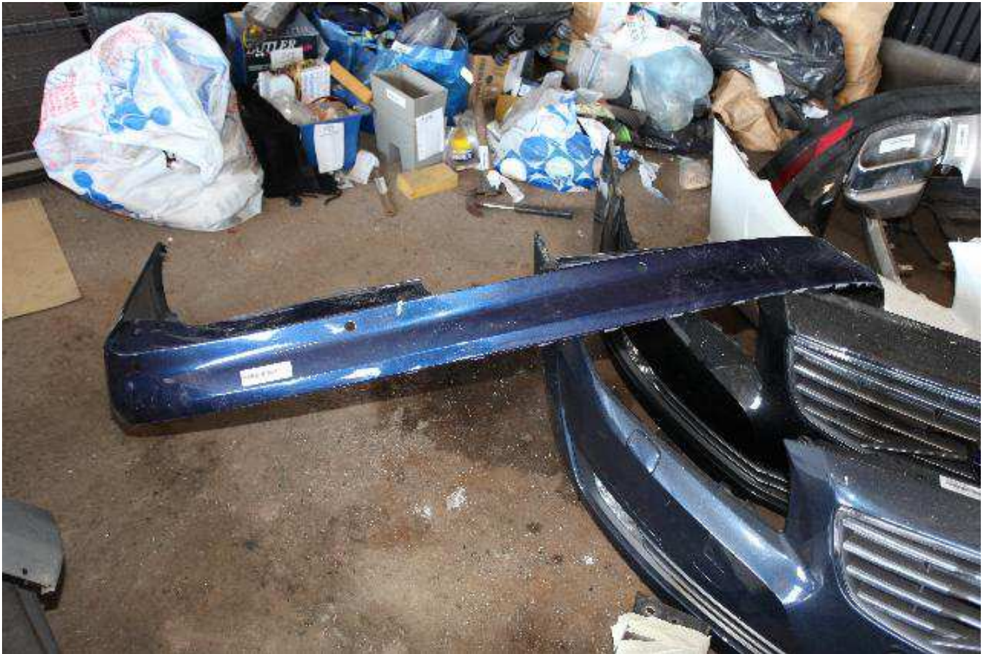
Fotografier på beslag 2015-5000-BG72931-10