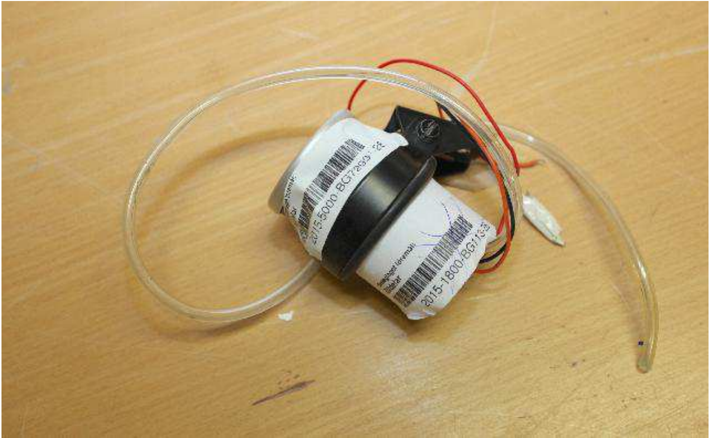
Fotografier på beslag 2015-5000-BG72931-28