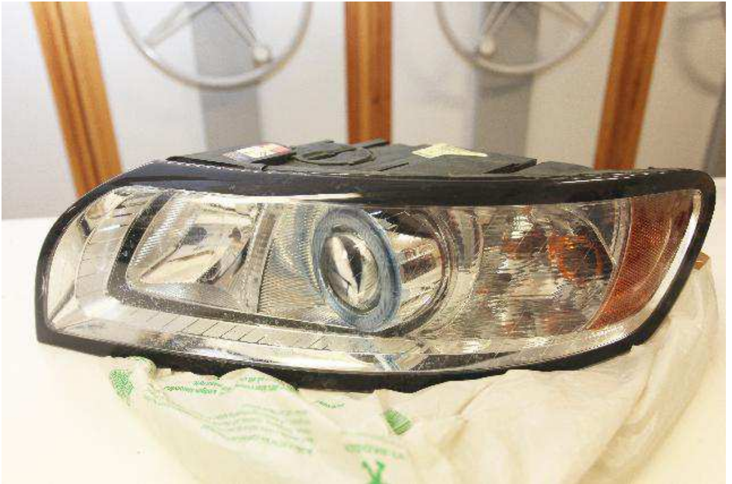
Fotografier på beslag 2015-5000-BG72182-3