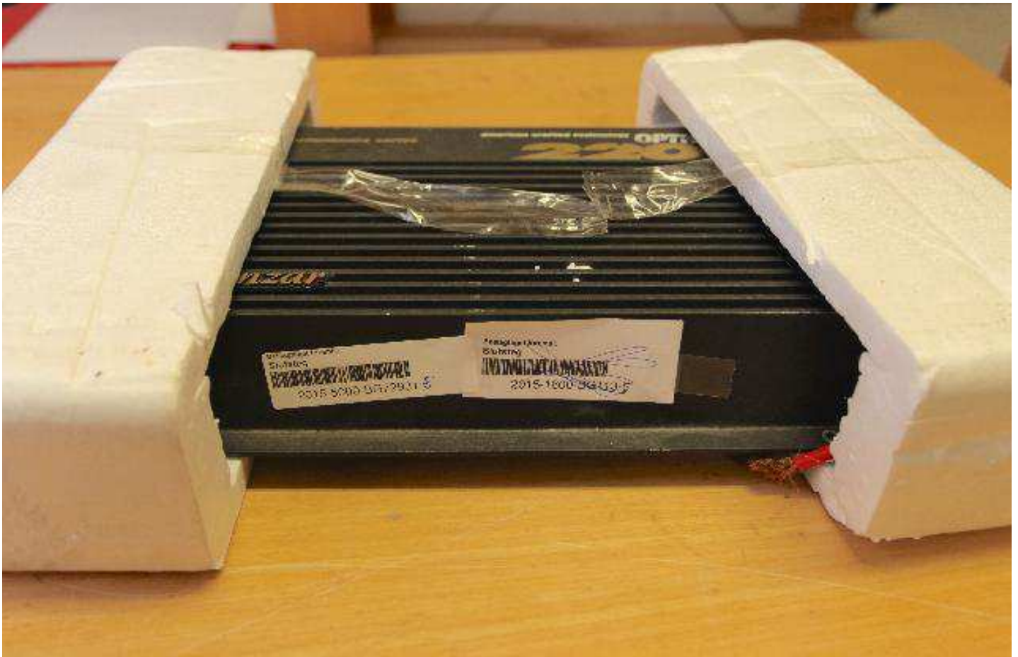
Fotografier på beslag 2015-5000-BG72931-5