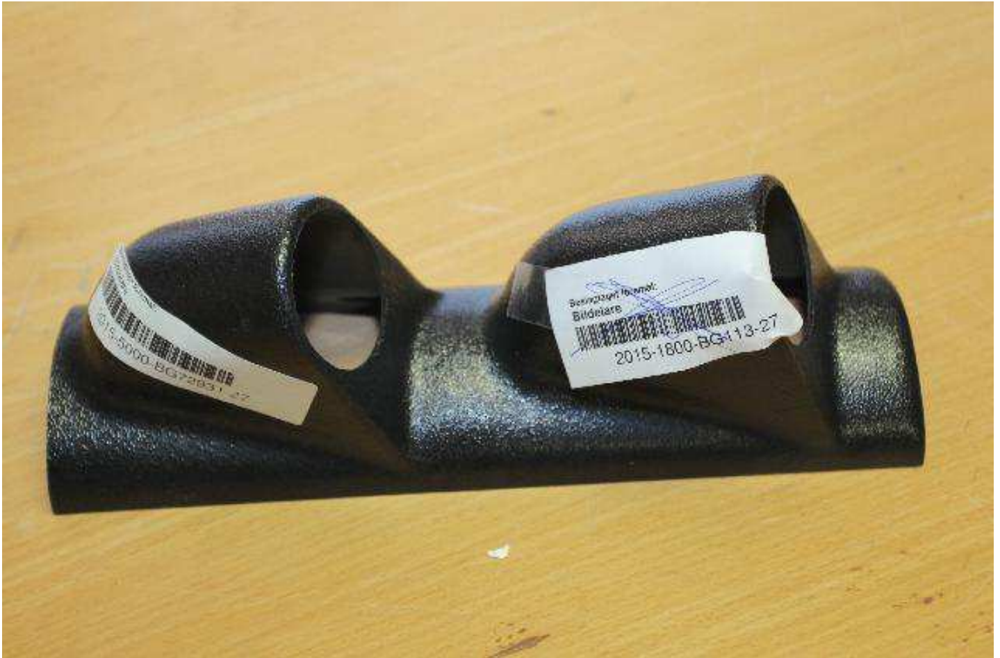
Fotografier på beslag 2015-5000-BG72931-27