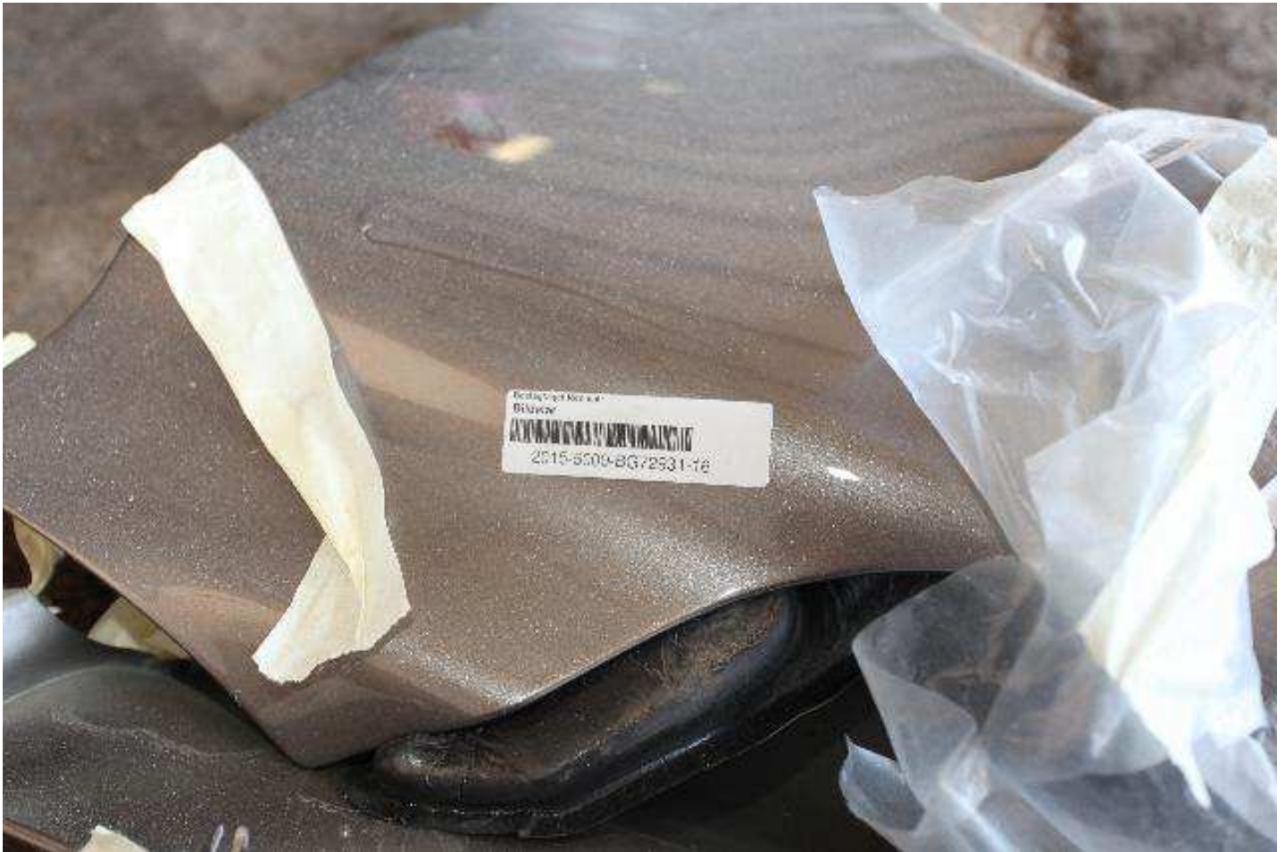
Fotografier på beslag 2015-5000-BG72931-16