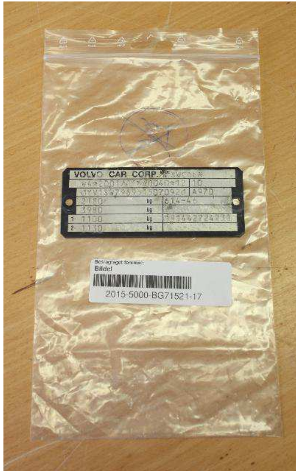
Fotografier på beslag 2015-5000_BG71521-17