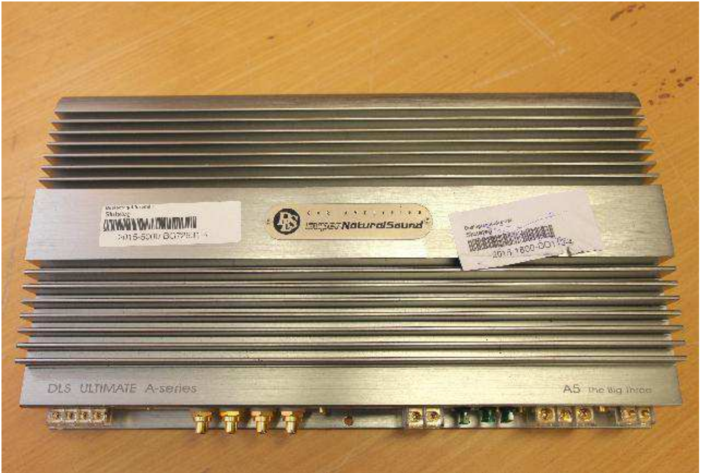
Fotografier på beslag 2015-5000-BG72931-4