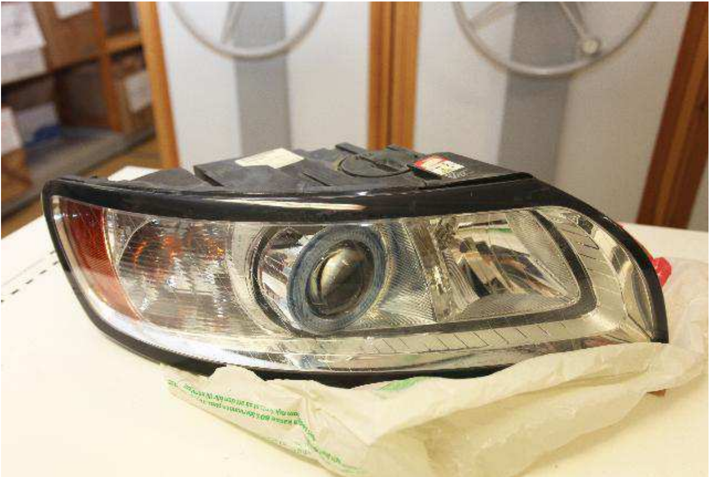
Fotografier på beslag 2015-5000-BG72182-2