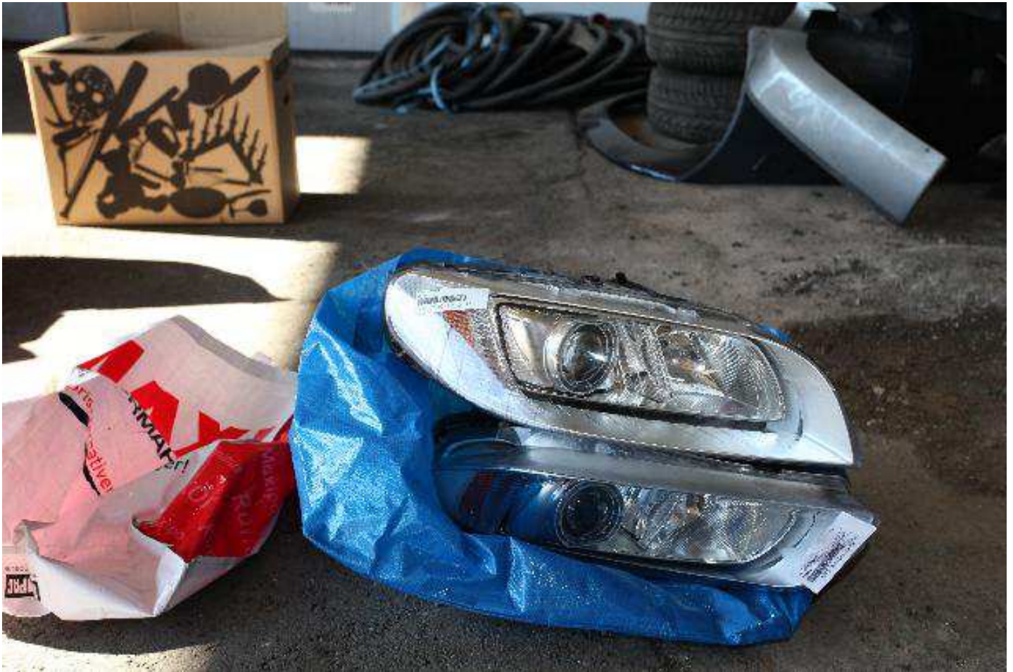
Fotografier på beslag 2015-5000-BG72931-12