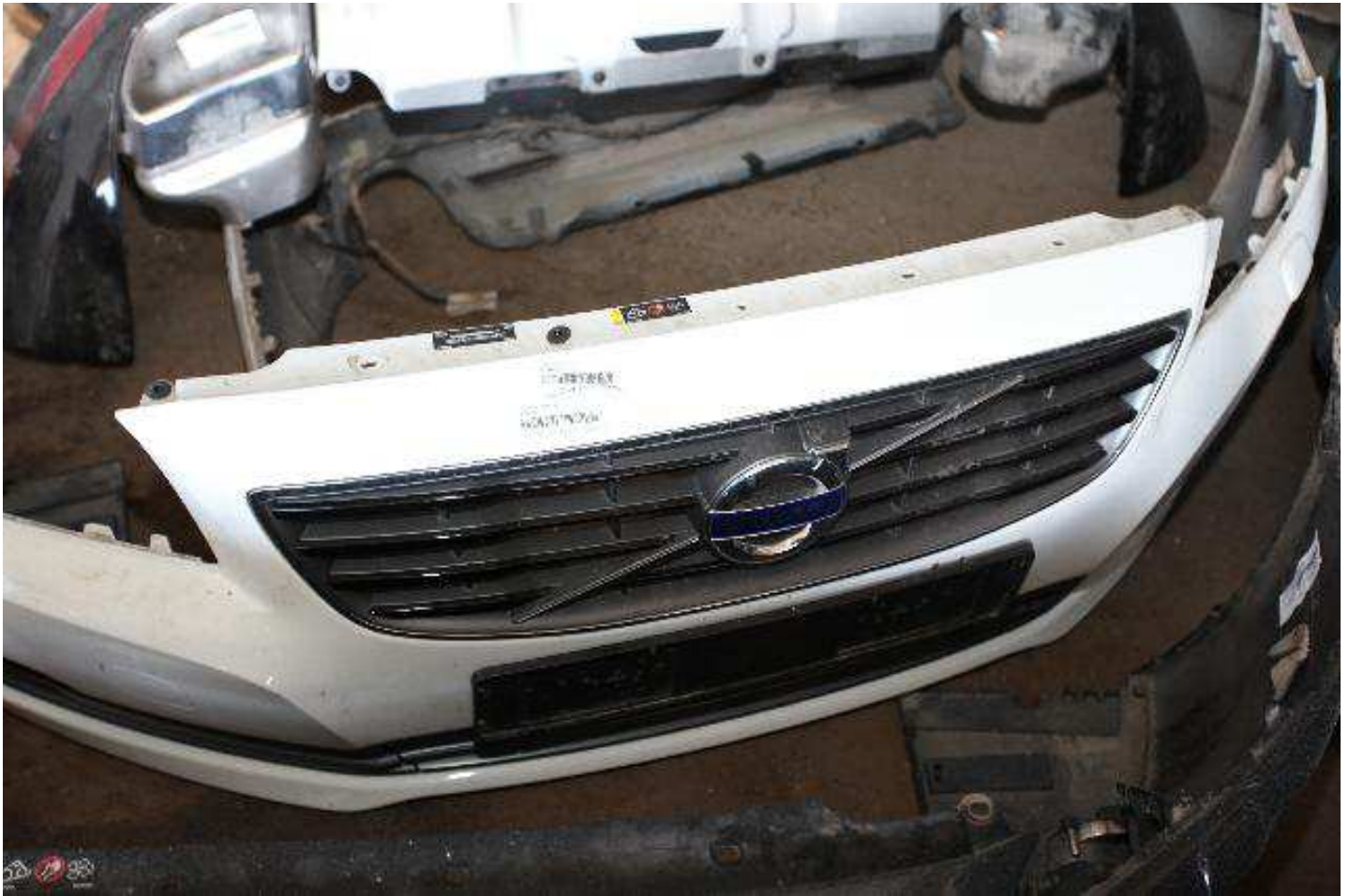
Fotografier på beslag 2015-5000-BG72931-8