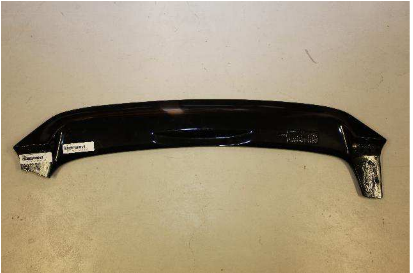
Fotografier på beslag 2015-5000_BG71521-22