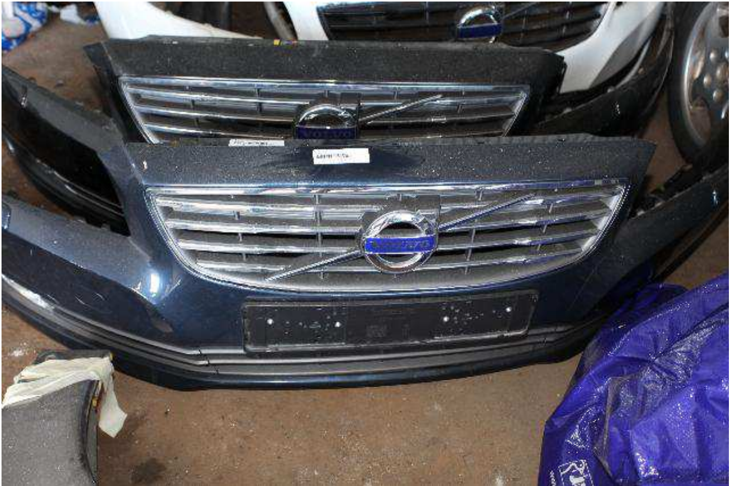
Fotografier på beslag 2015-5000-BG72931-7