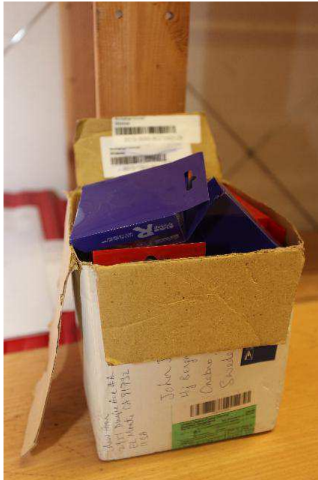
Fotografier på beslag 2015-5000-BG72931-29