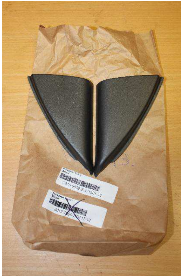
Fotografier på beslag 2015-5000_BG71521-13