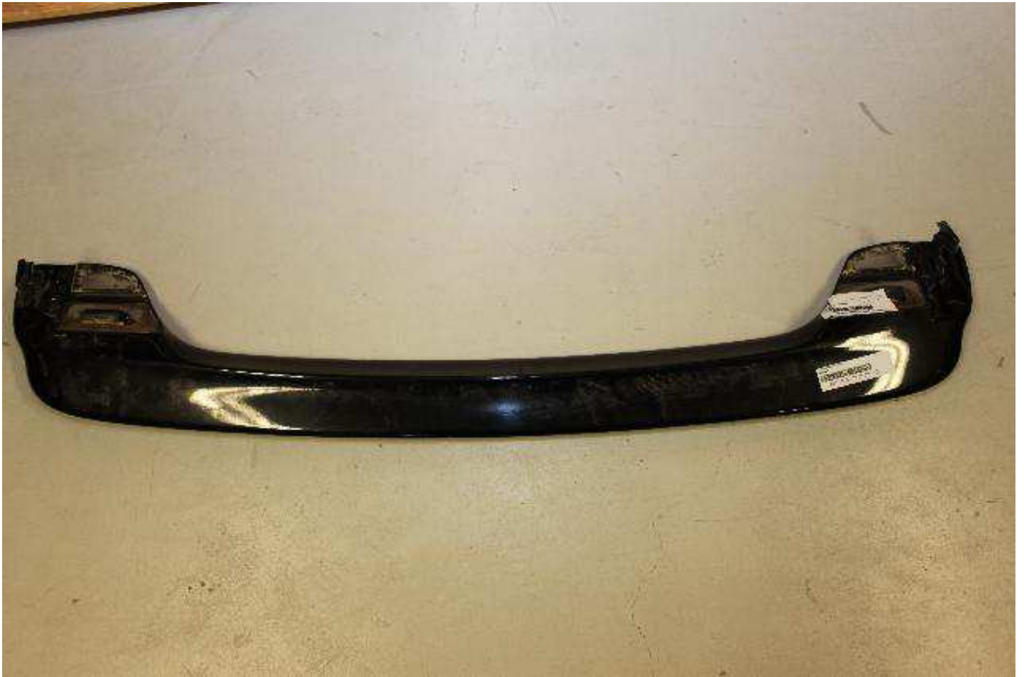
Fotografier på beslag 2015-5000_BG71521-23