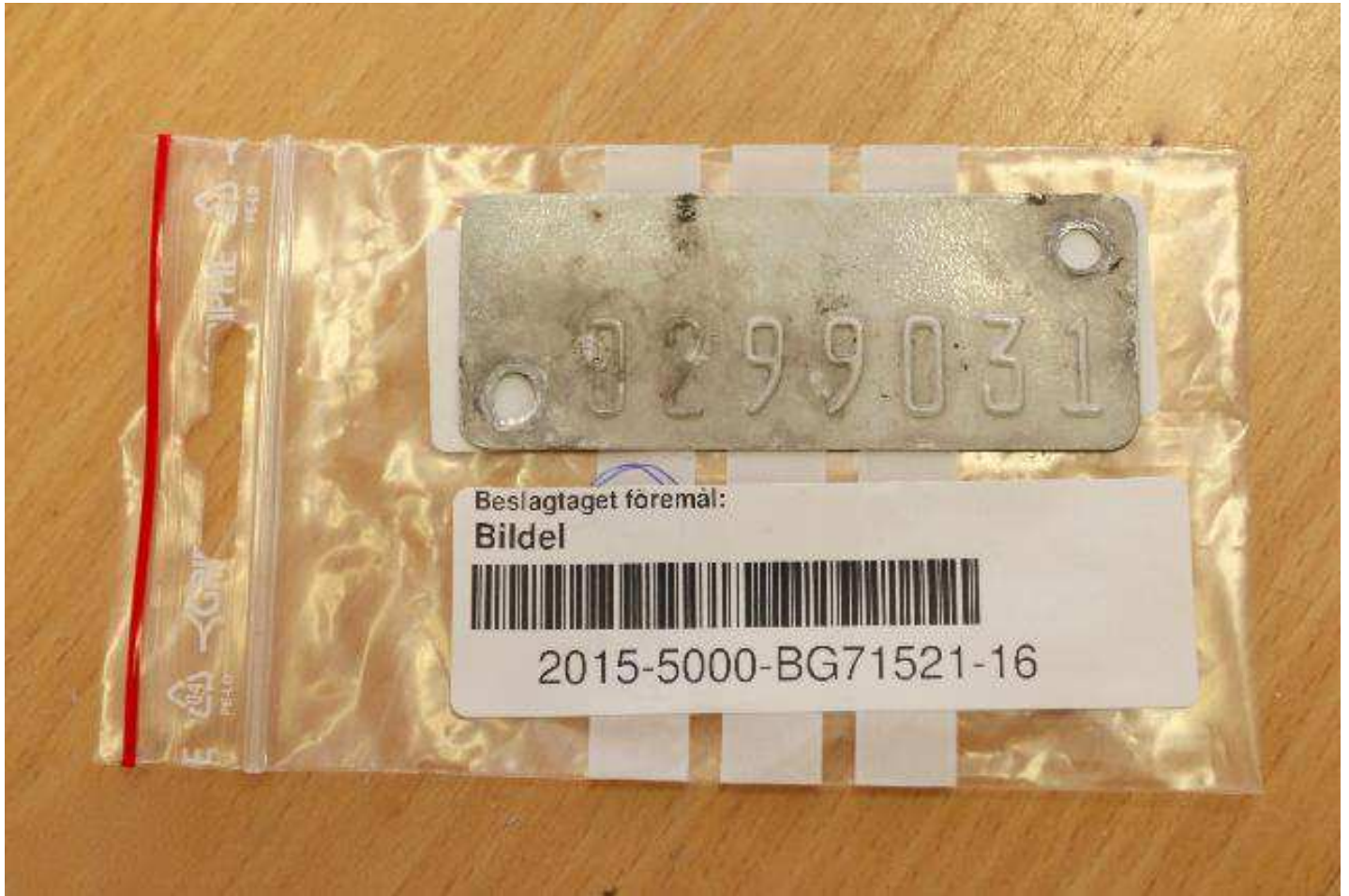
Fotografier på beslag 2015-5000_BG71521-16