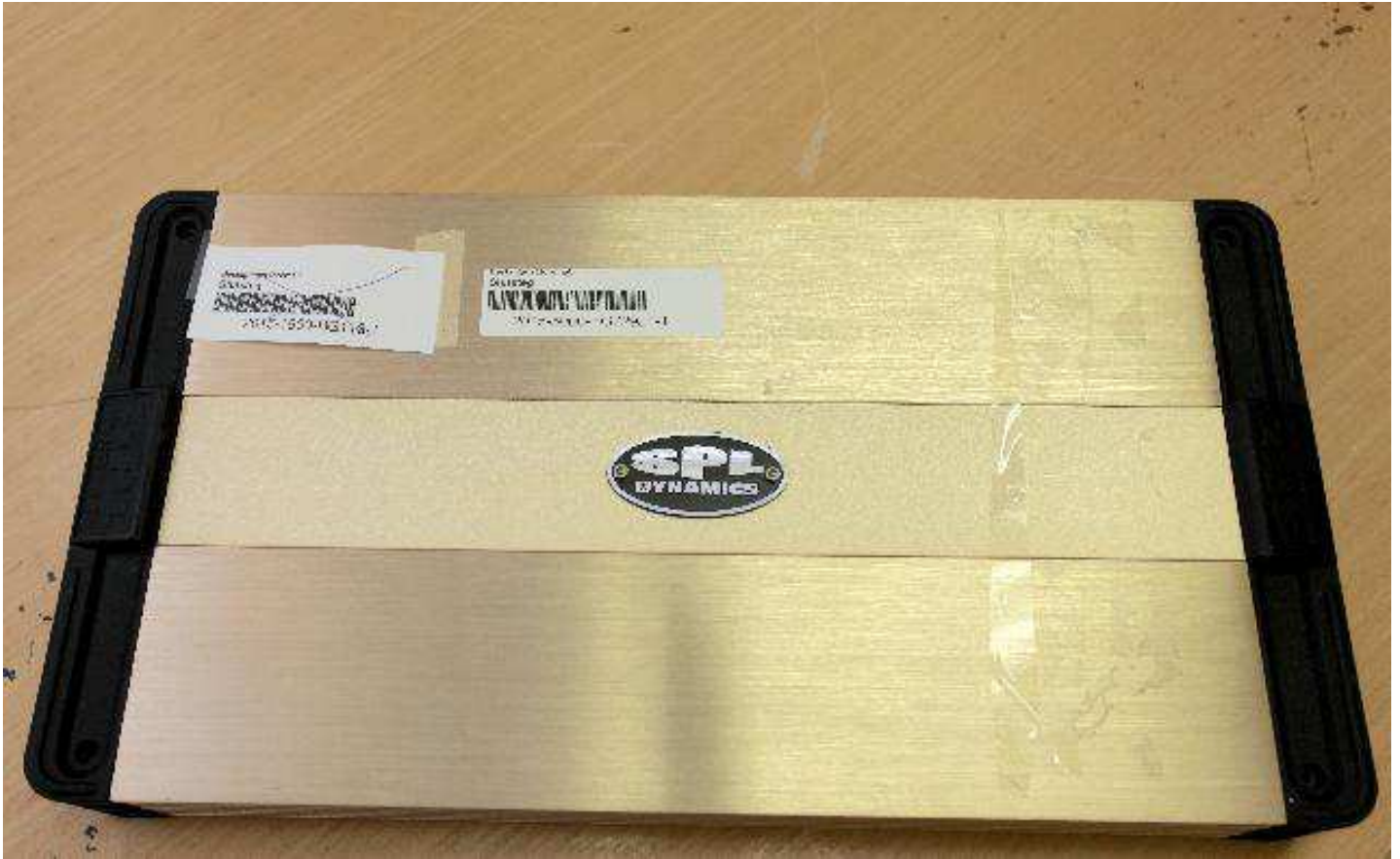
Fotografier på beslag 2015-5000-BG72931-1