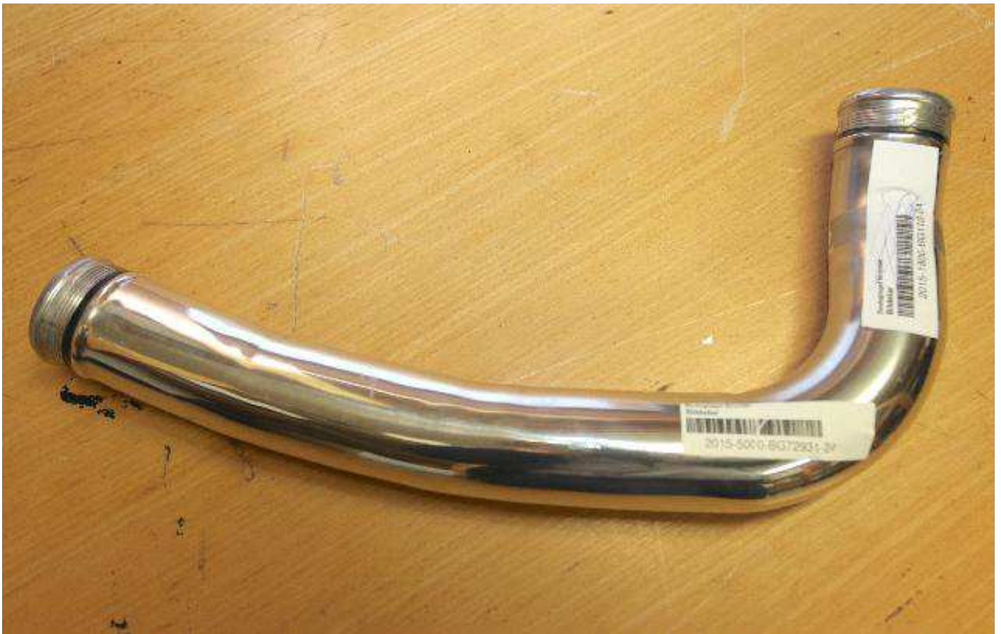
Fotografier på beslag 2015-5000-BG72931-24