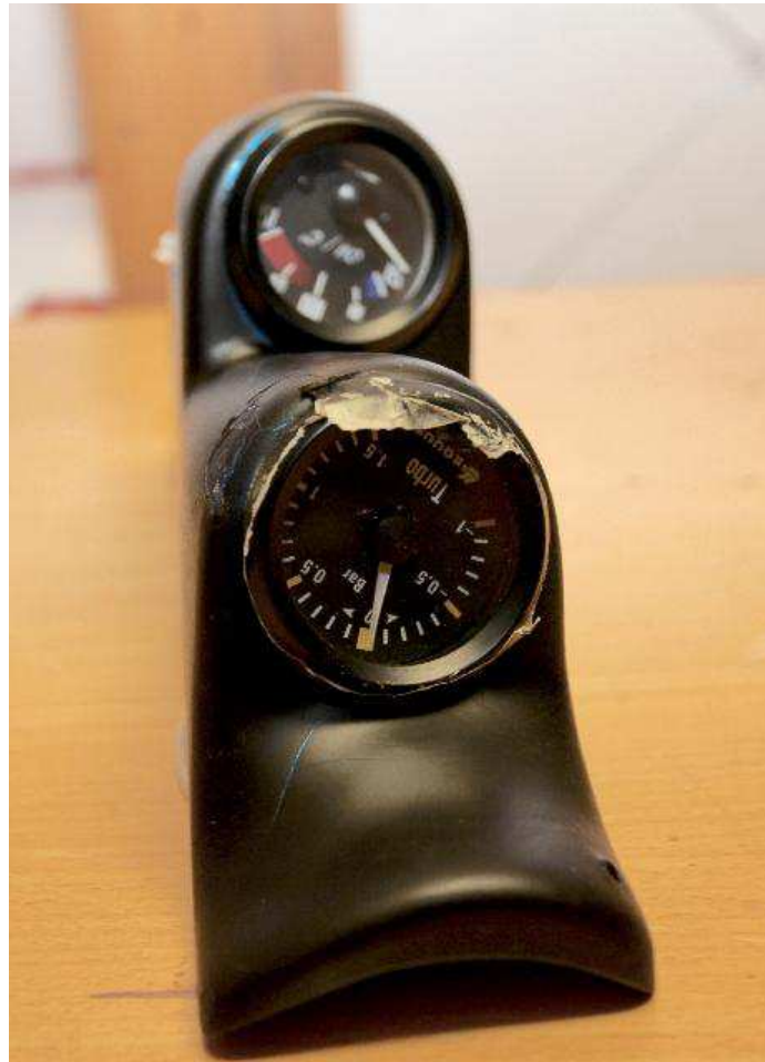
Fotografier på beslag 2015-5000-BG72931-26