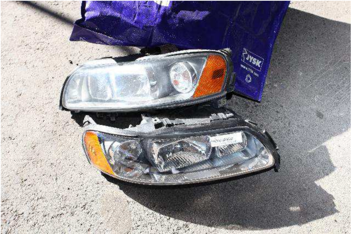
Fotografier på beslag 2015-5000-BG72931-13