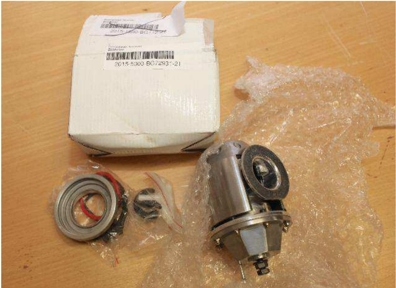
Fotografier på beslag 2015-5000-BG72931-21