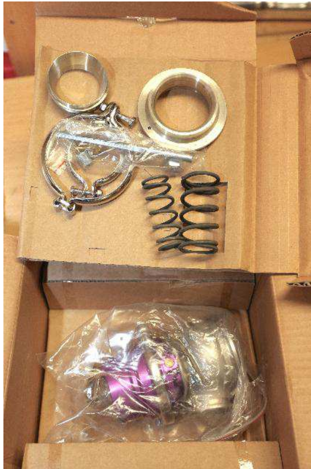
Fotografier på beslag 2015-5000-BG72931-19