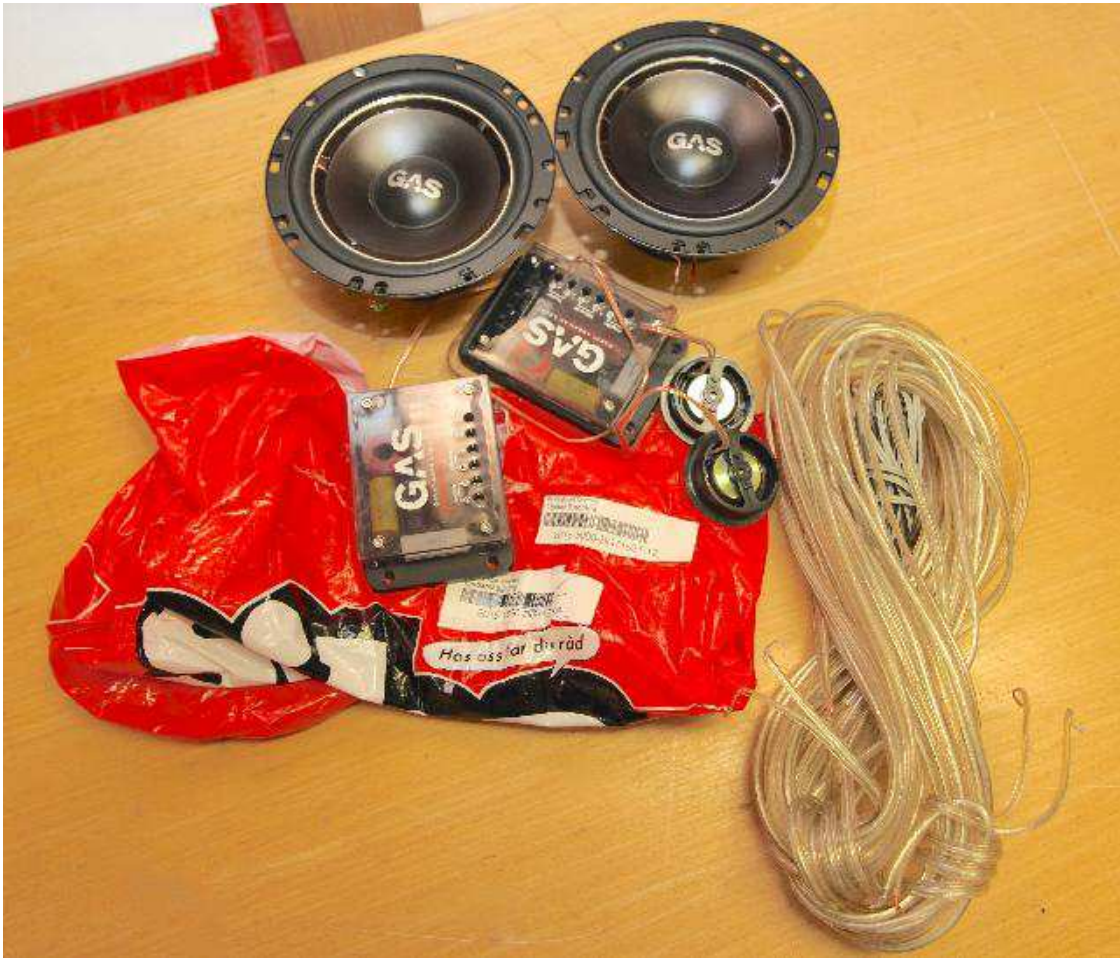
Fotografier på beslag 2015-5000_BG71521-12