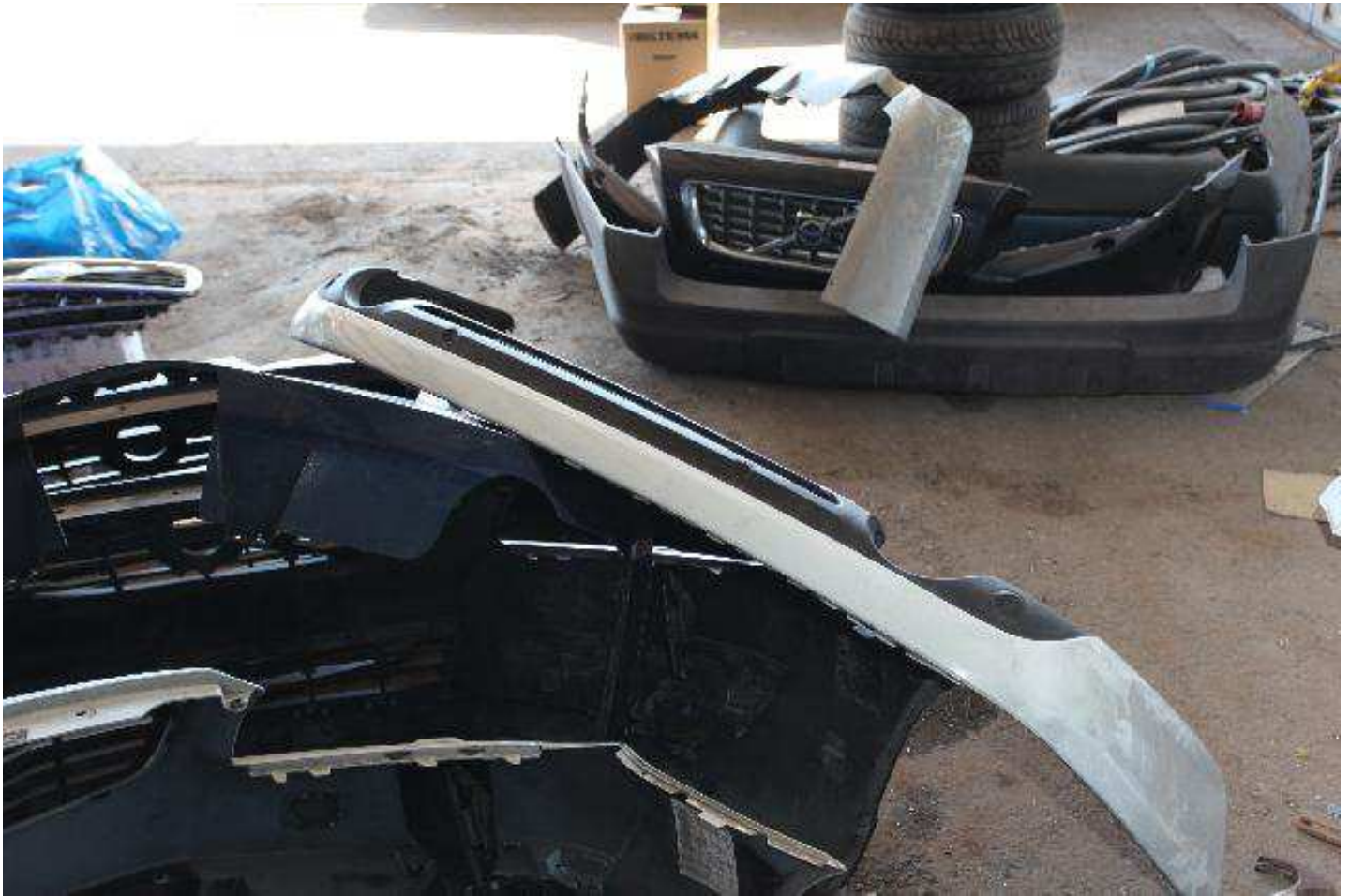
Fotografier på beslag 2015-5000-BG72931-11