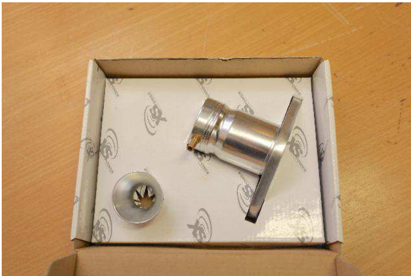
Fotografier på beslag 2015-5000-BG72931-17