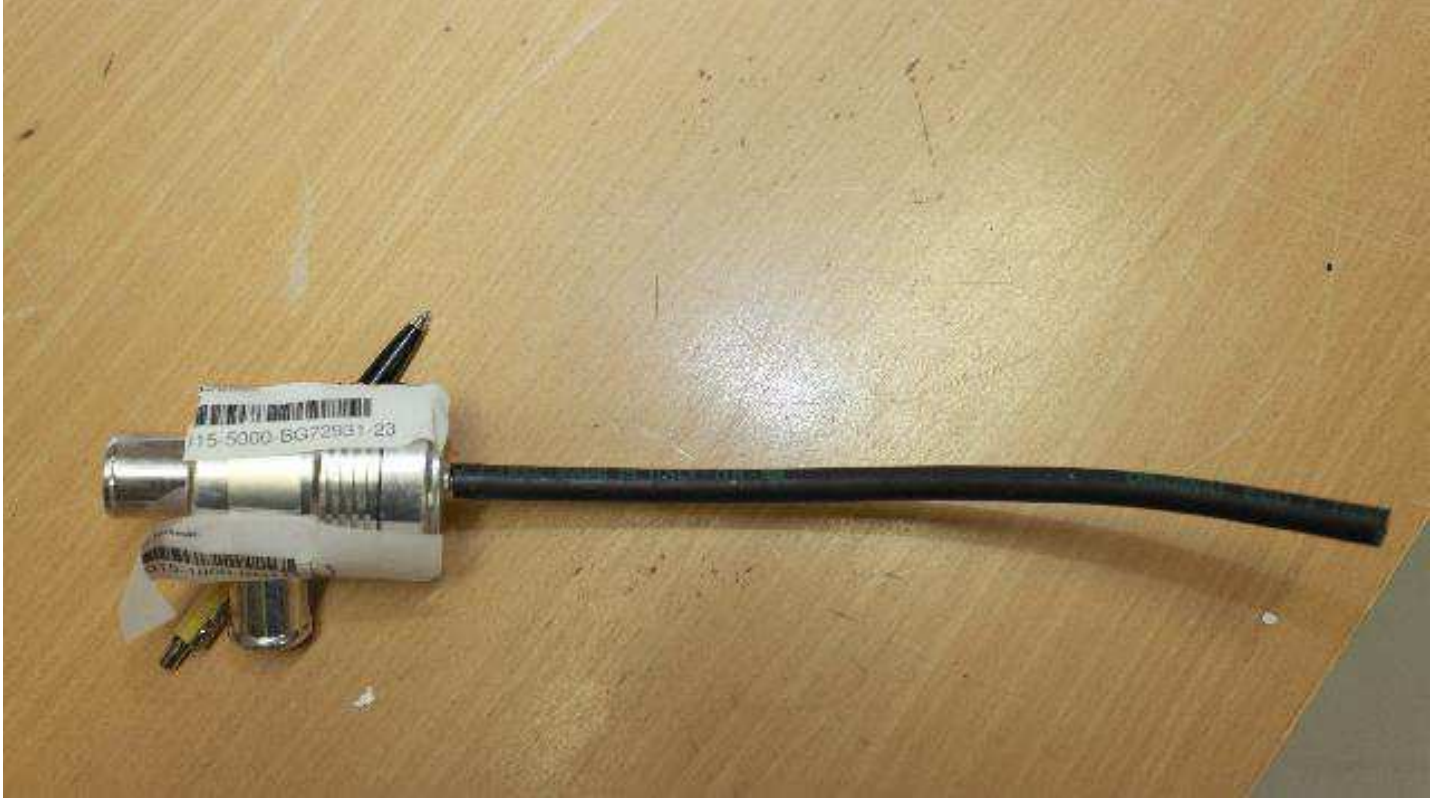
Fotografier på beslag 2015-5000-BG72931-23