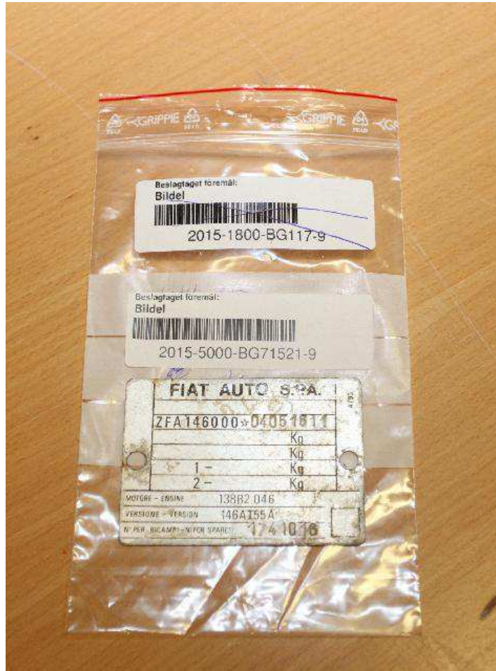
Fotografier på beslag 2015-5000_BG71521-9