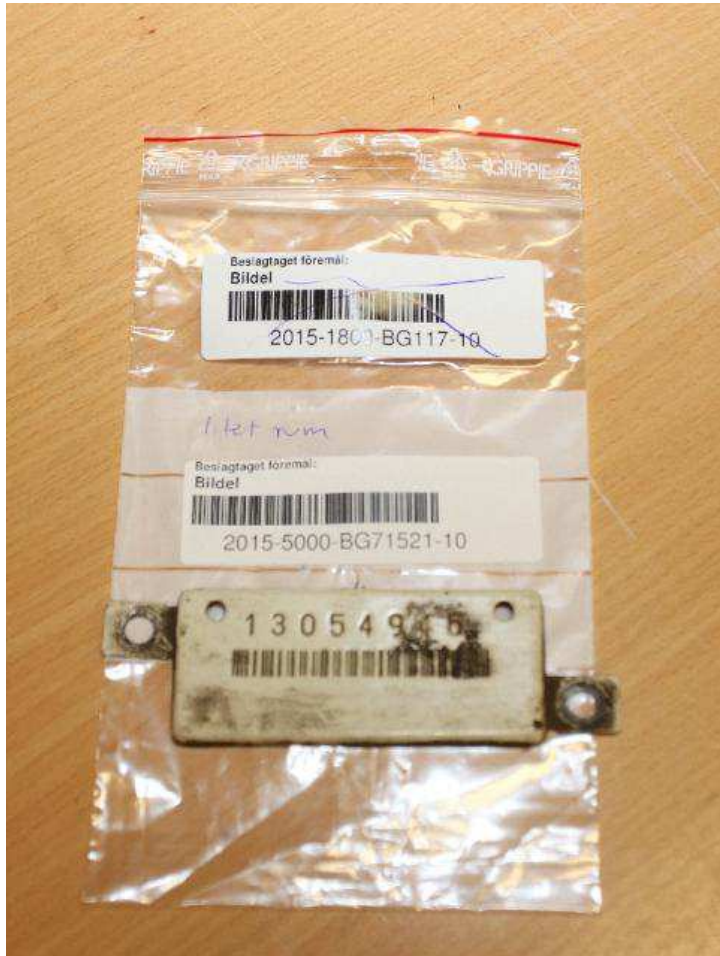
Fotografier på beslag 2015-5000_BG71521-10