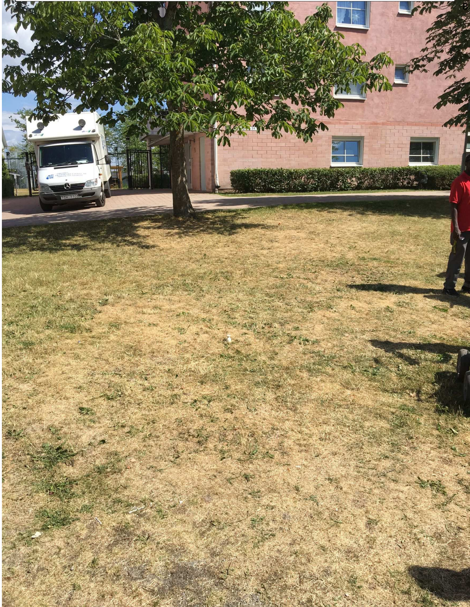
hylsan hittades ligger vid den vita koppen