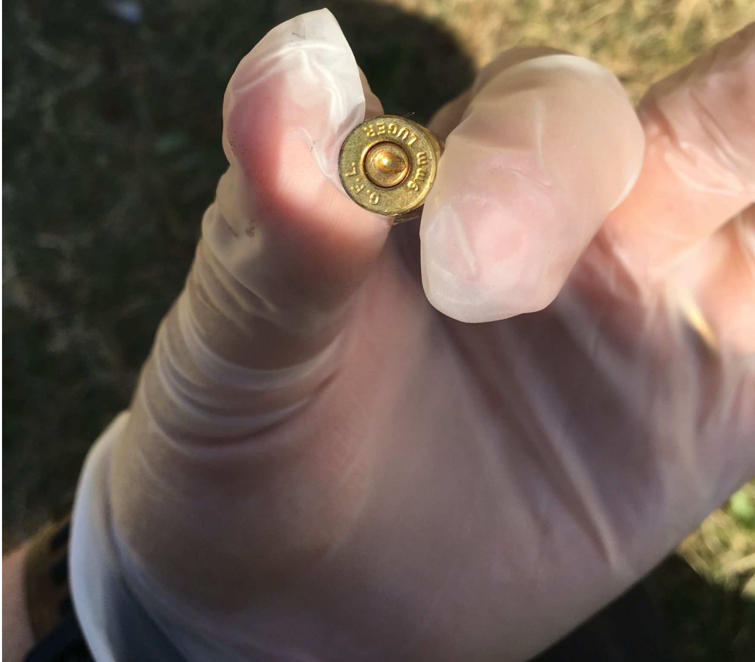
Baksidan av hylsan.