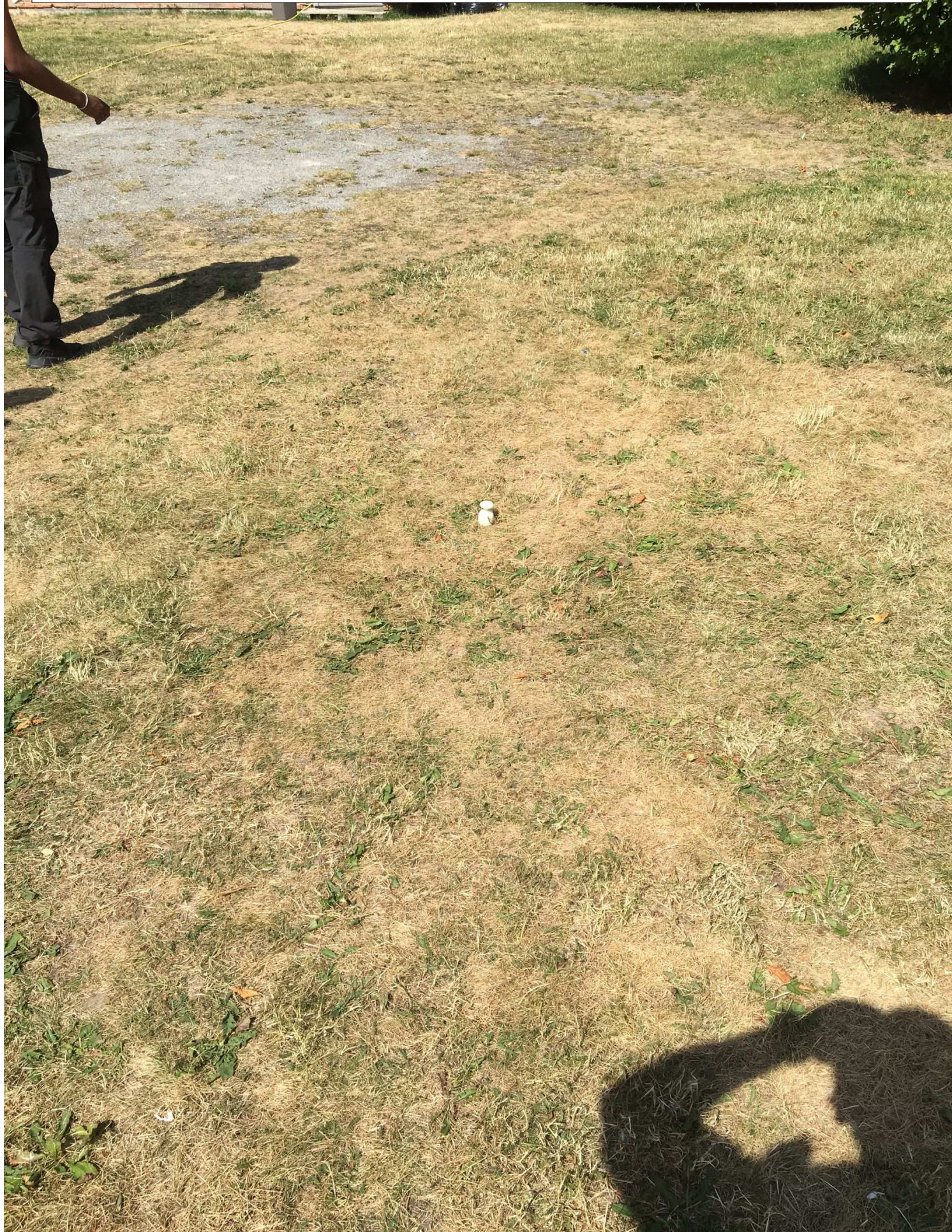
hylsan hittades ligger vid den vita koppen