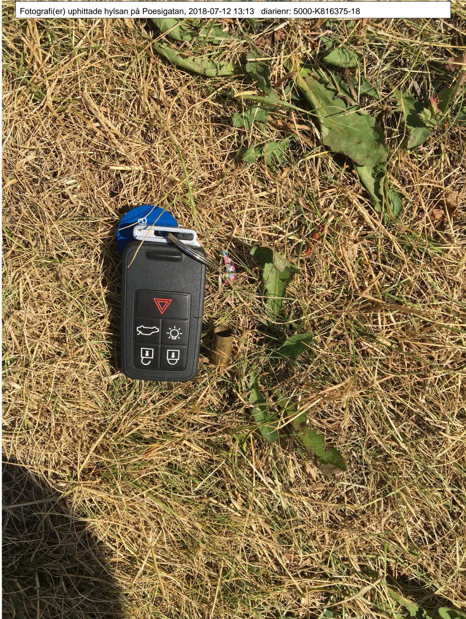
Storleken på hylsan.