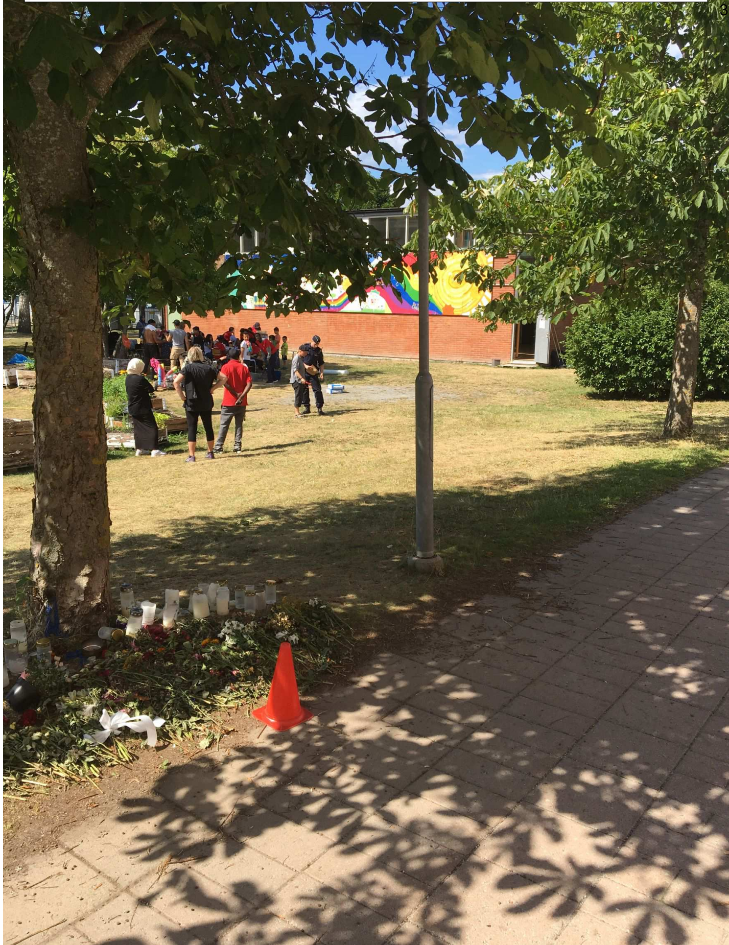
hylsan hittades ligger vid den vita koppen bredvid polismannen.