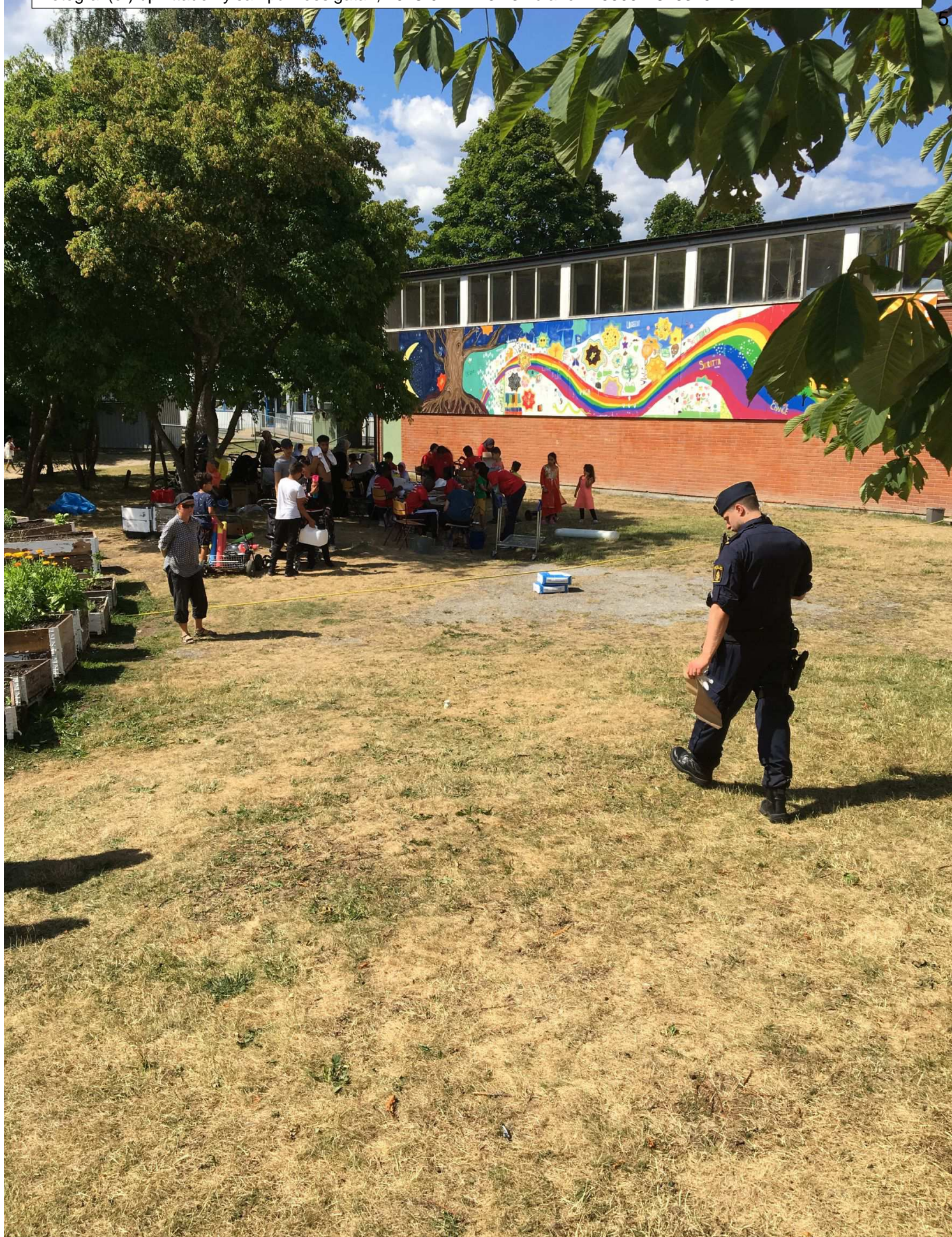
Hylsan hittades ligger vid den vita koppen.