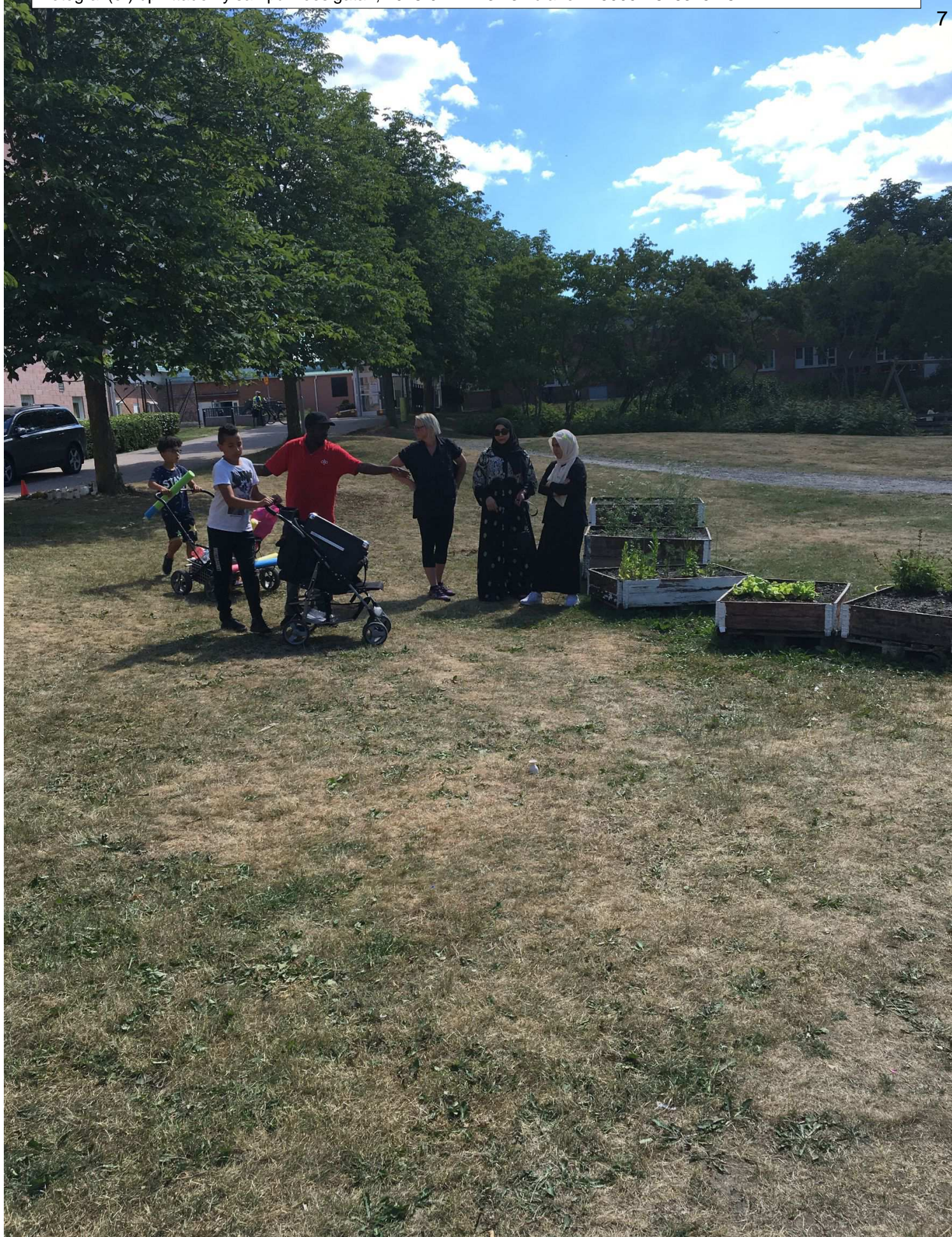
hylsan hittades ligger vid den vita koppen