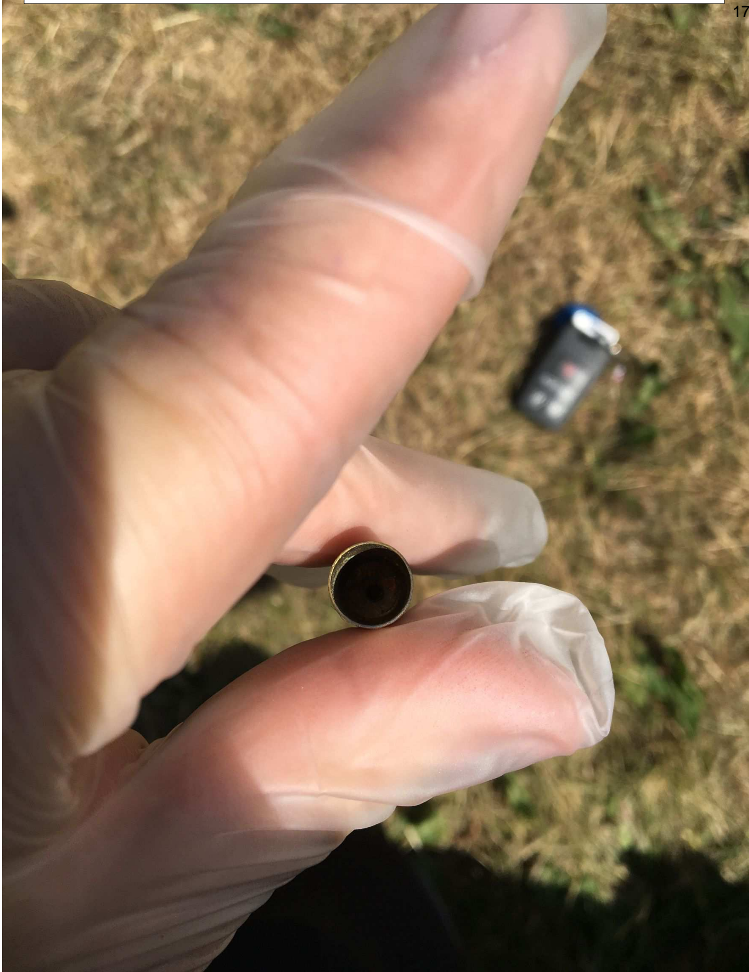
Framsidan på hylsan.