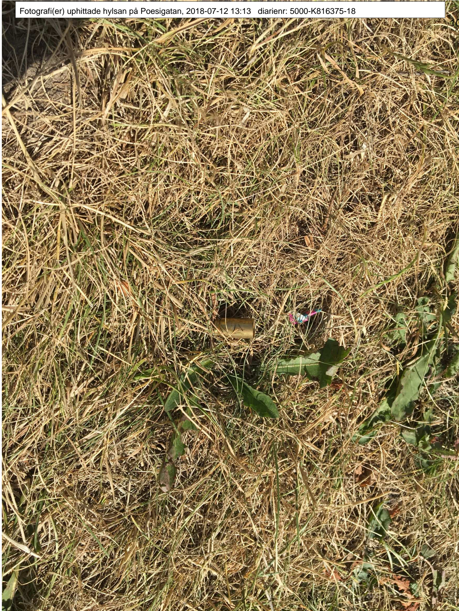
Hylsan låg där den vita pappappersbiten ligger, kvinnan som hittade den säger att hylsan var lite inkilad i gräset som pappret är.