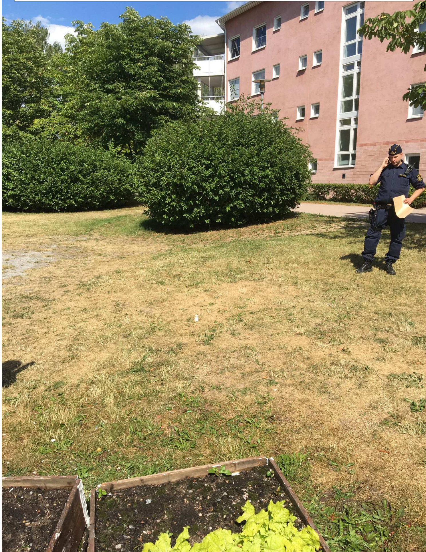
hylsan hittades ligger vid den vita koppen