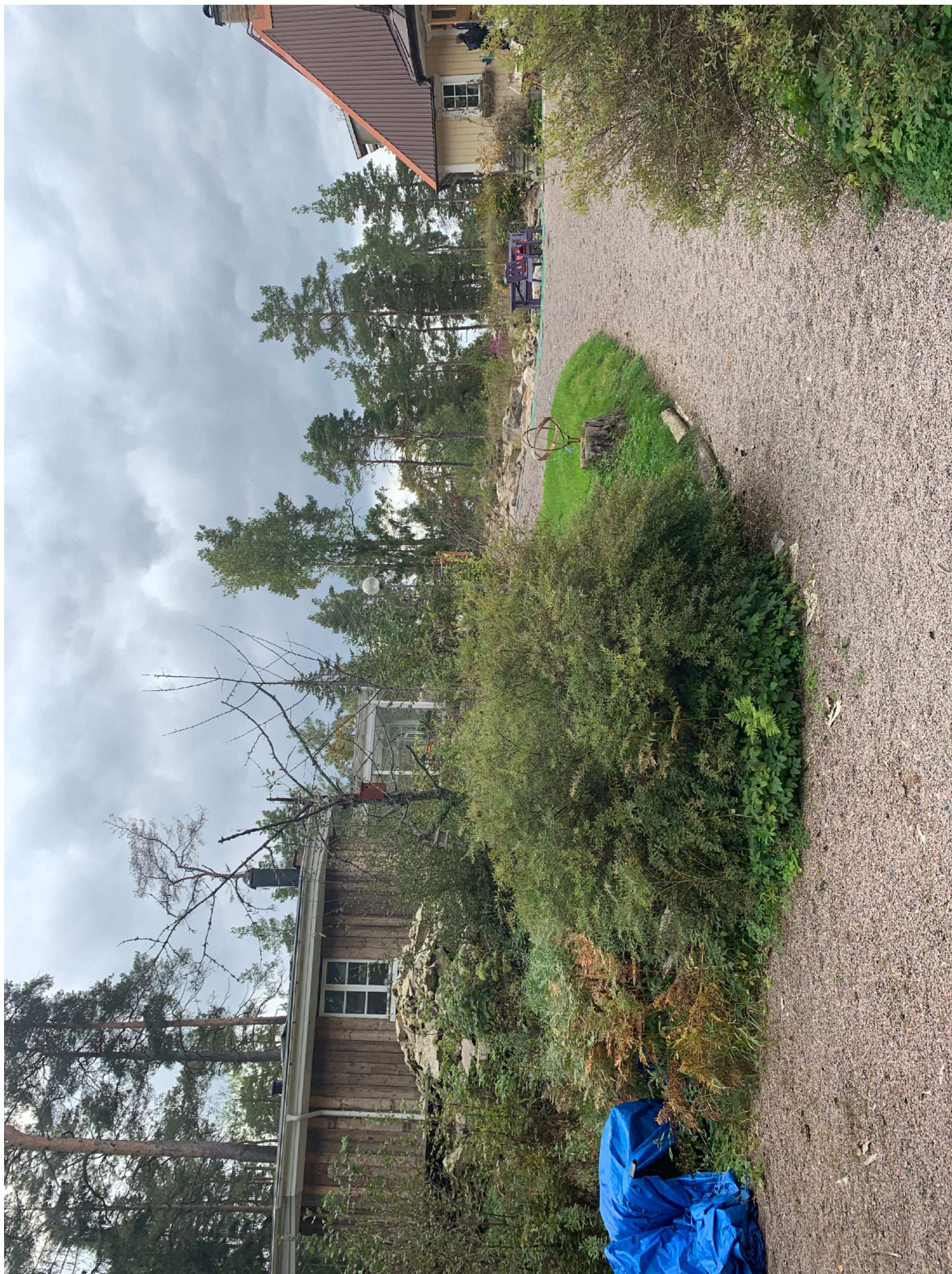
1. Uppfart.