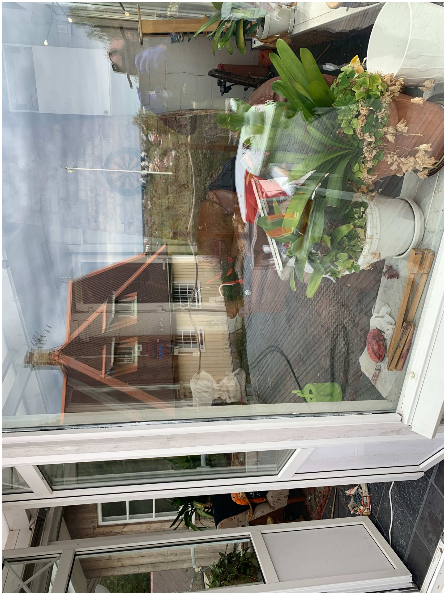
12. Foto genom ruta. Misstänkt väska syns i bild.