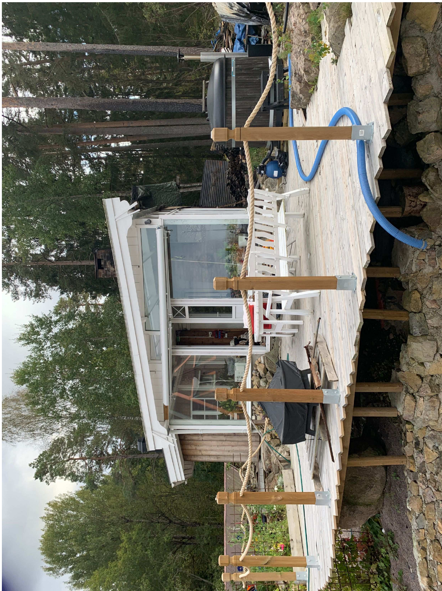
9. Tralldäck samt uthus.