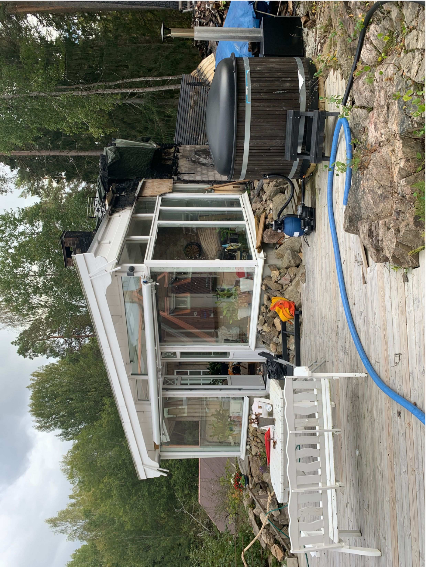
10. Uthus.