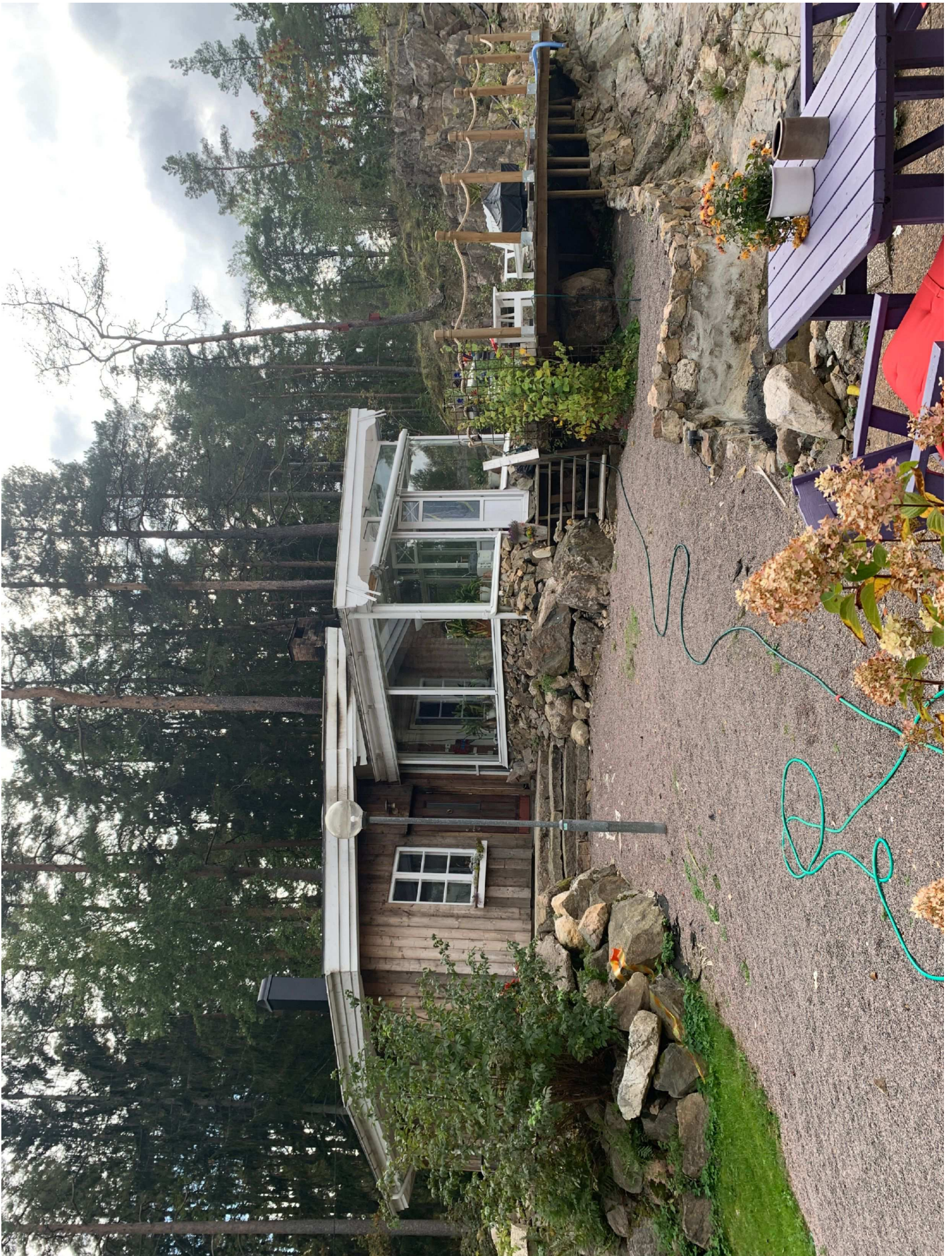
6. Uthus med inglasad del.