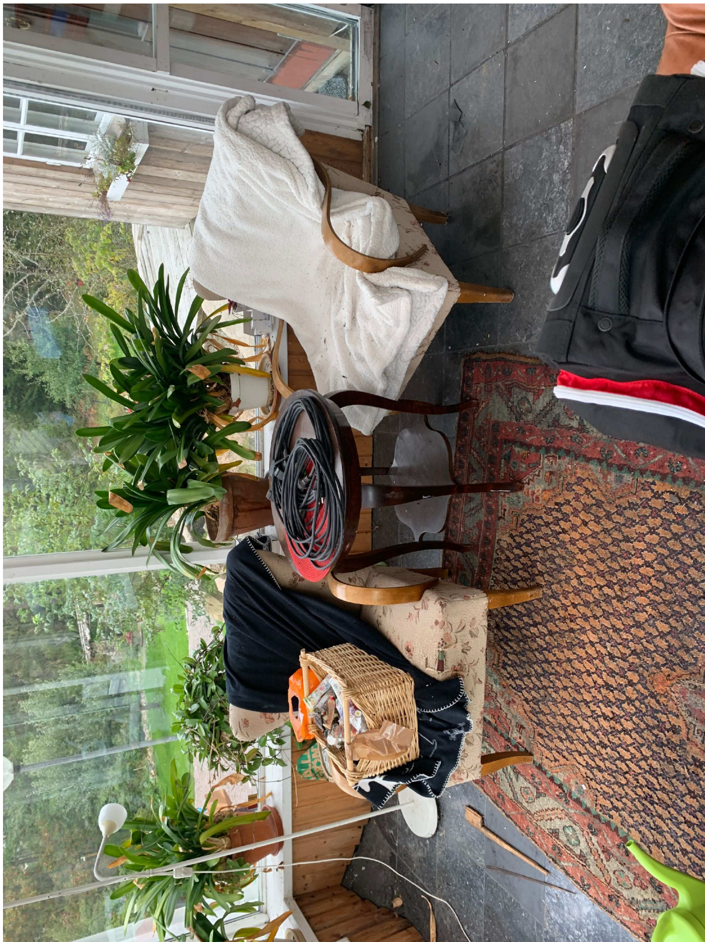
27. Översiktsbild av uterum.