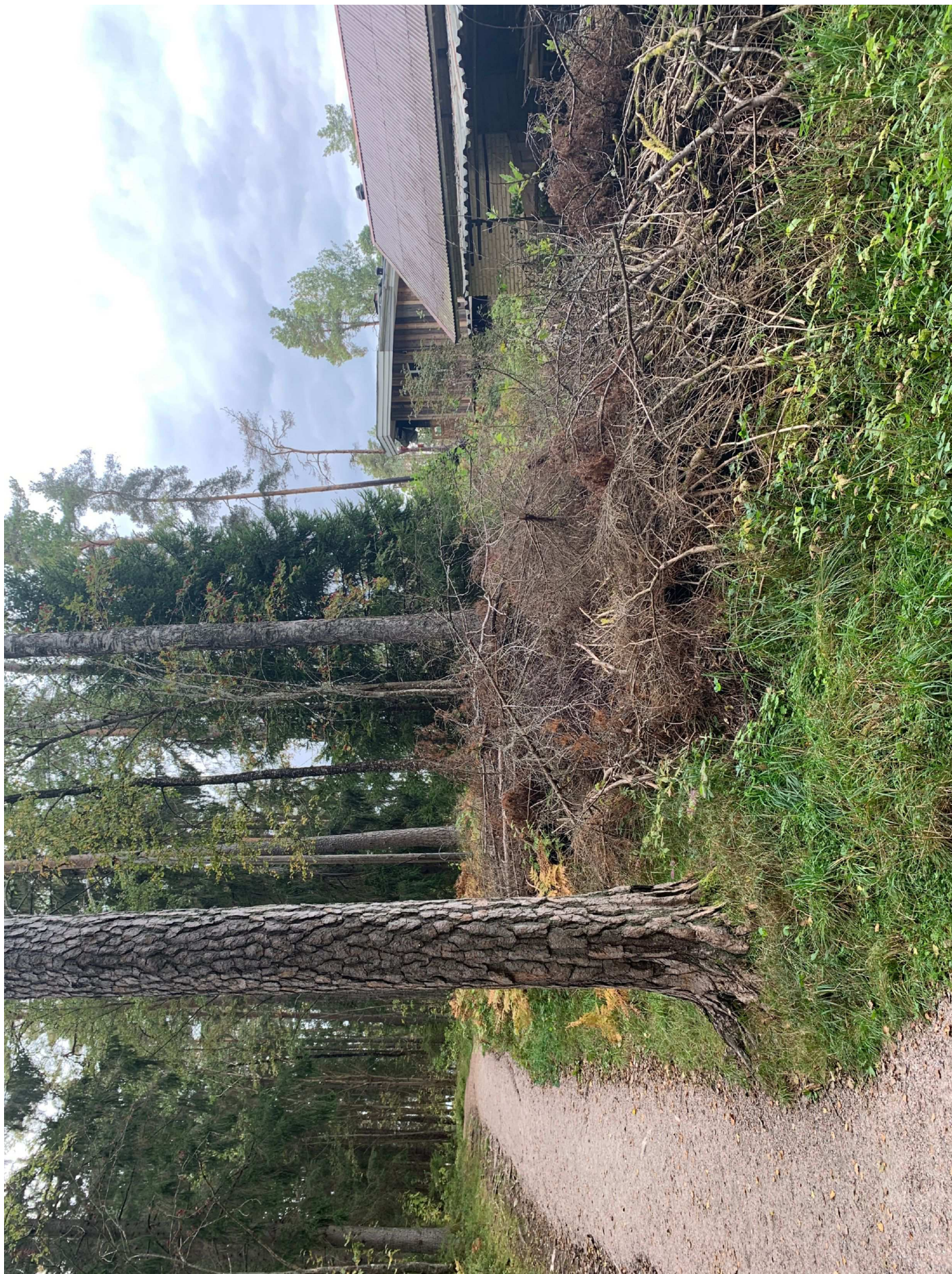
4. motions slinga som ligger i anslutning till fastigheten.