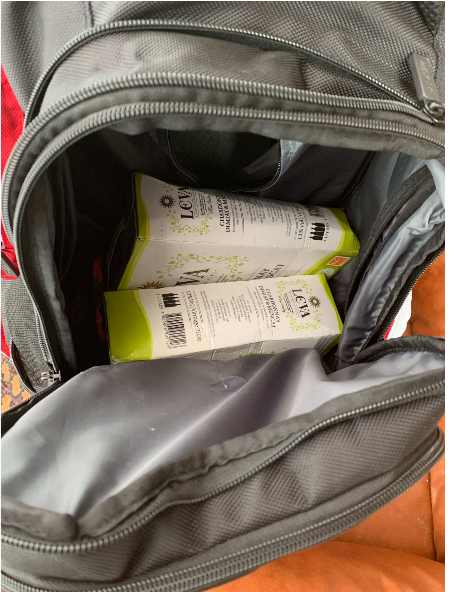
23. Fack 3.