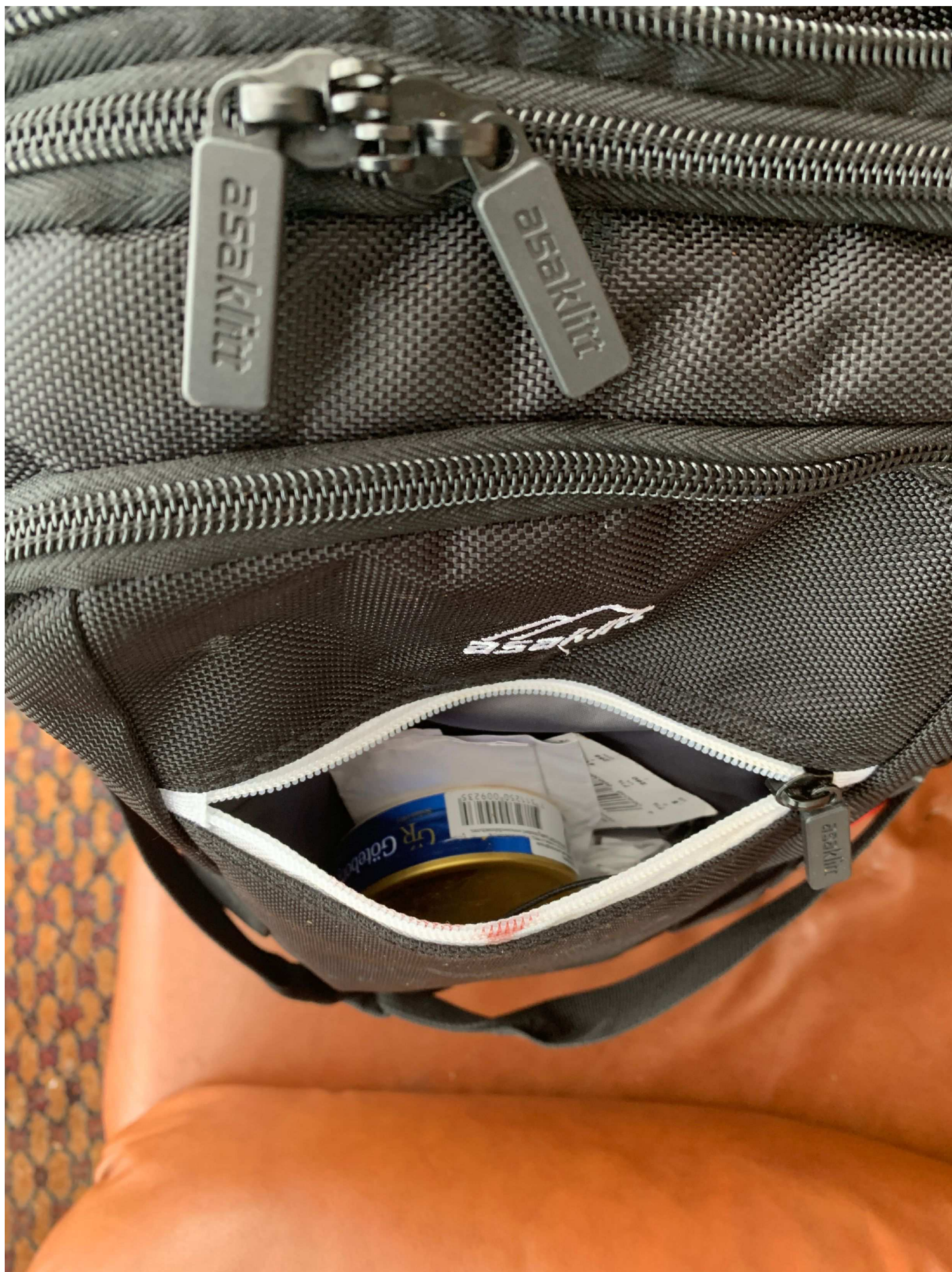
21. Fack 1.