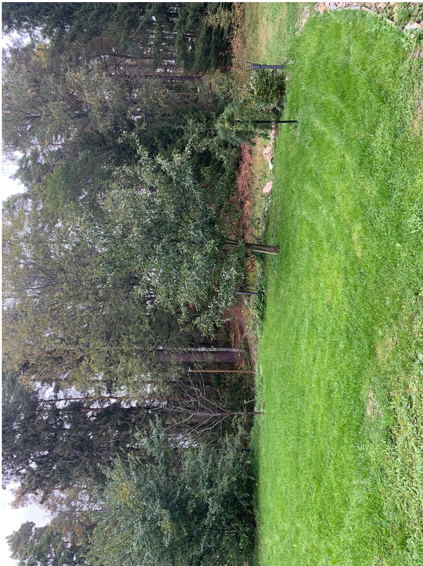
30. Foto mot mot sörbybacken.