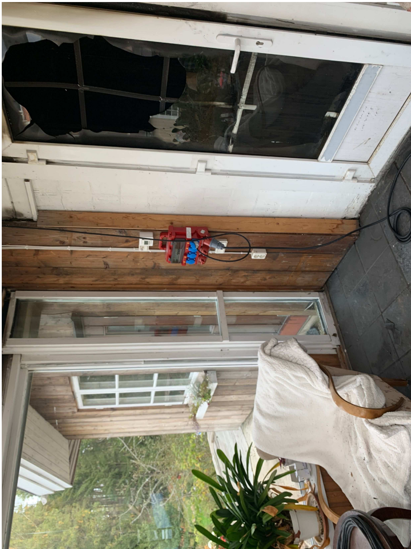
20. Översiktsbild.