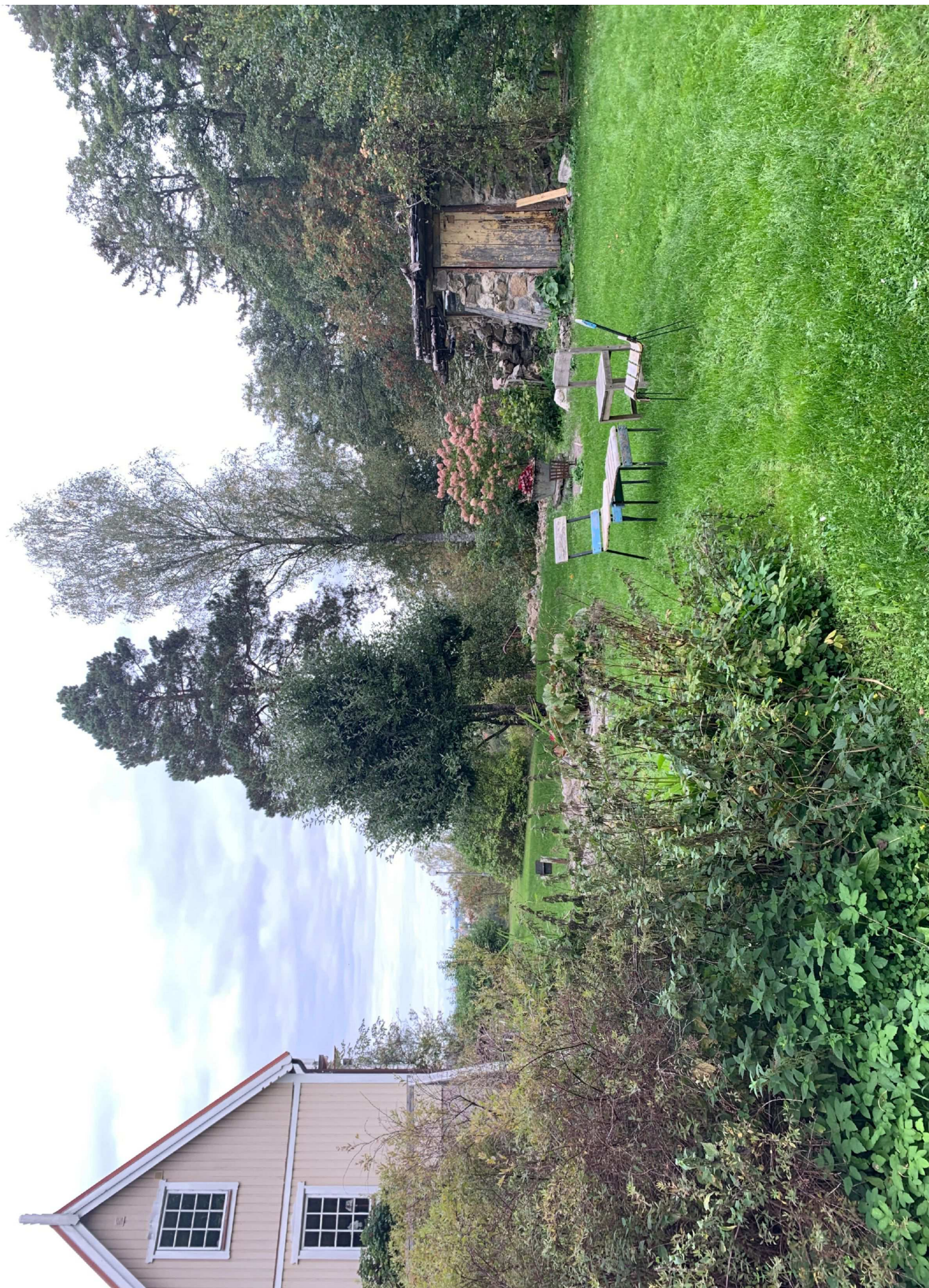
29. Foto från uppfart.