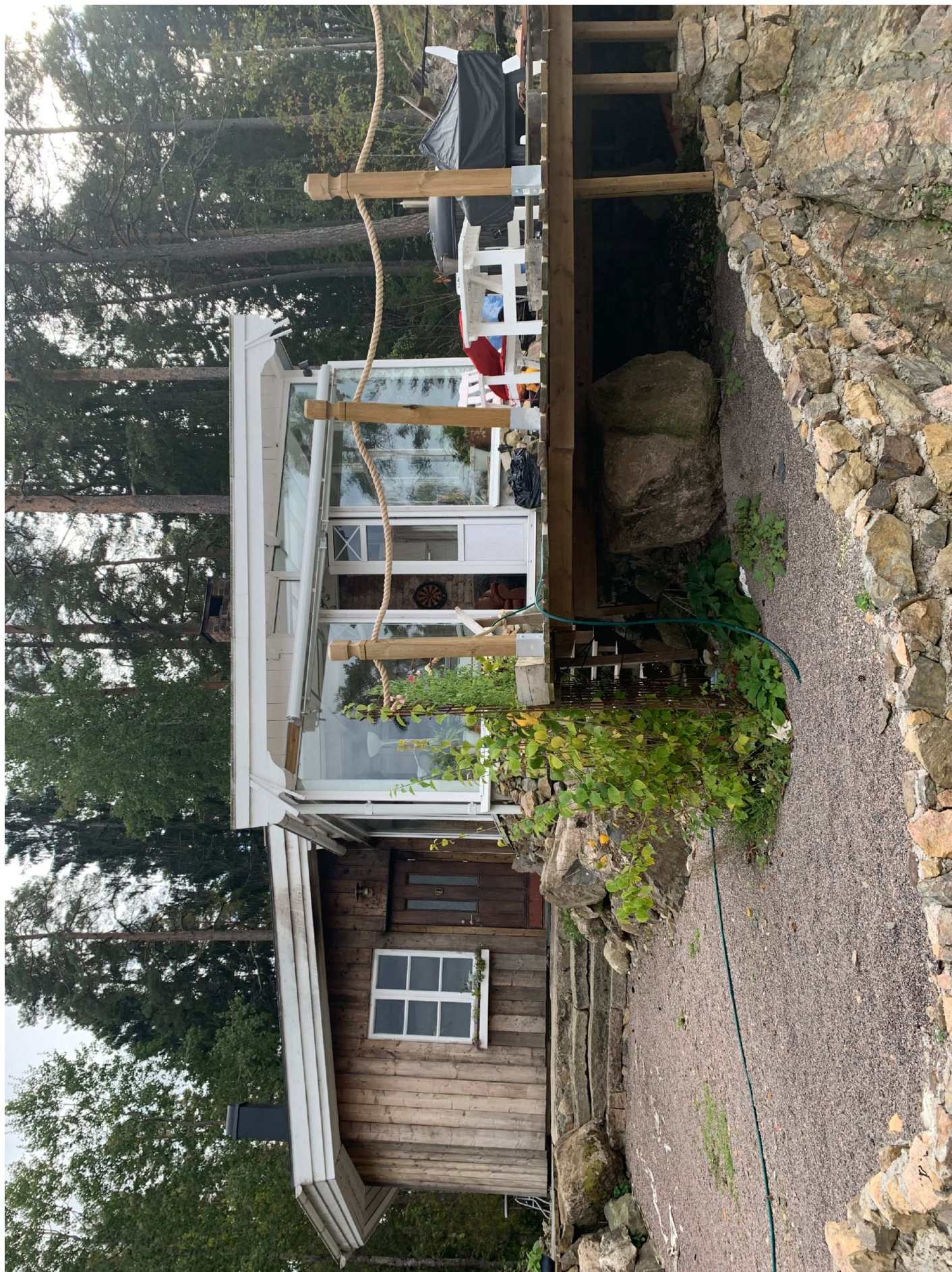
7. Uthus, glashuset är där väskan upphittades.