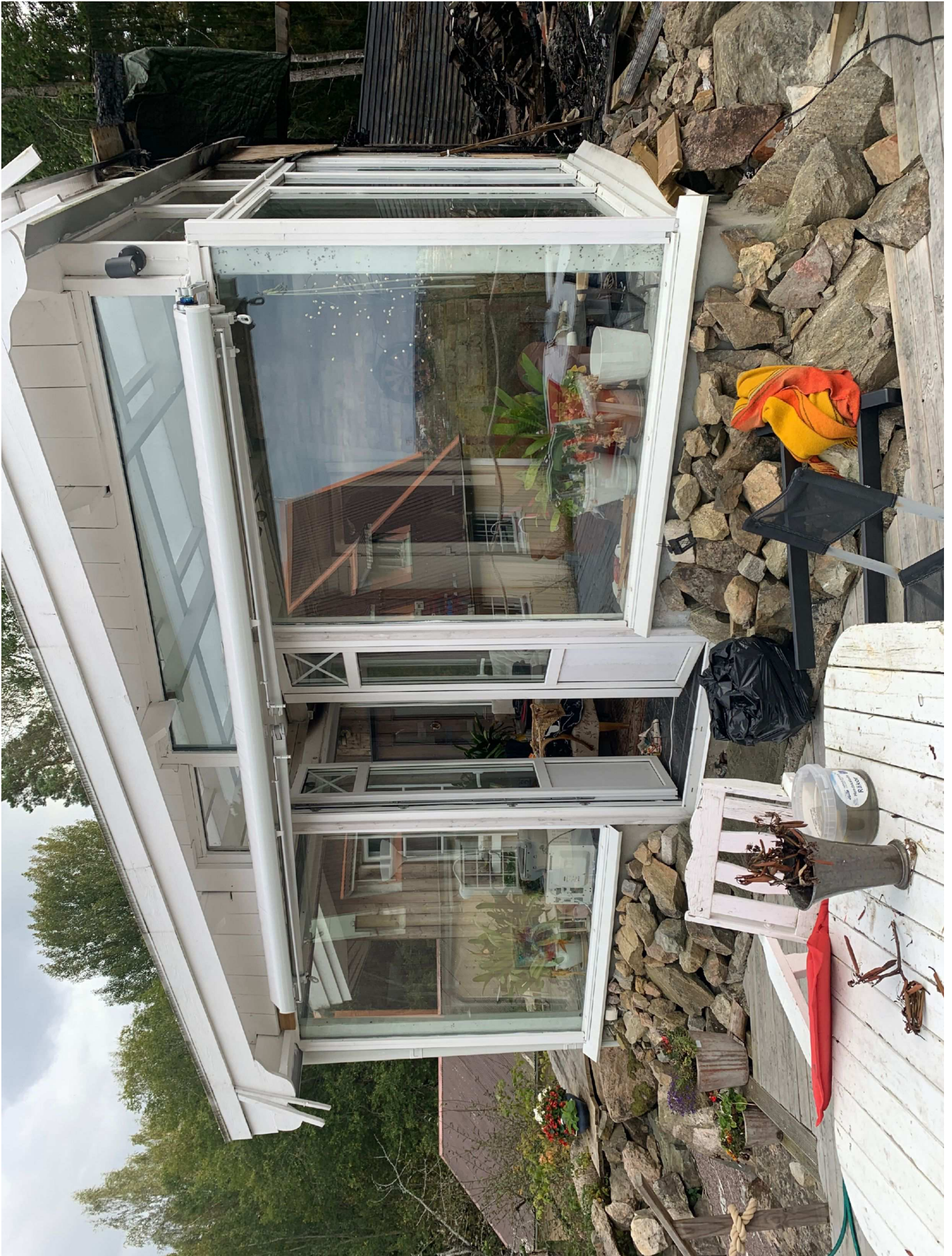
11. Ingång uthus.