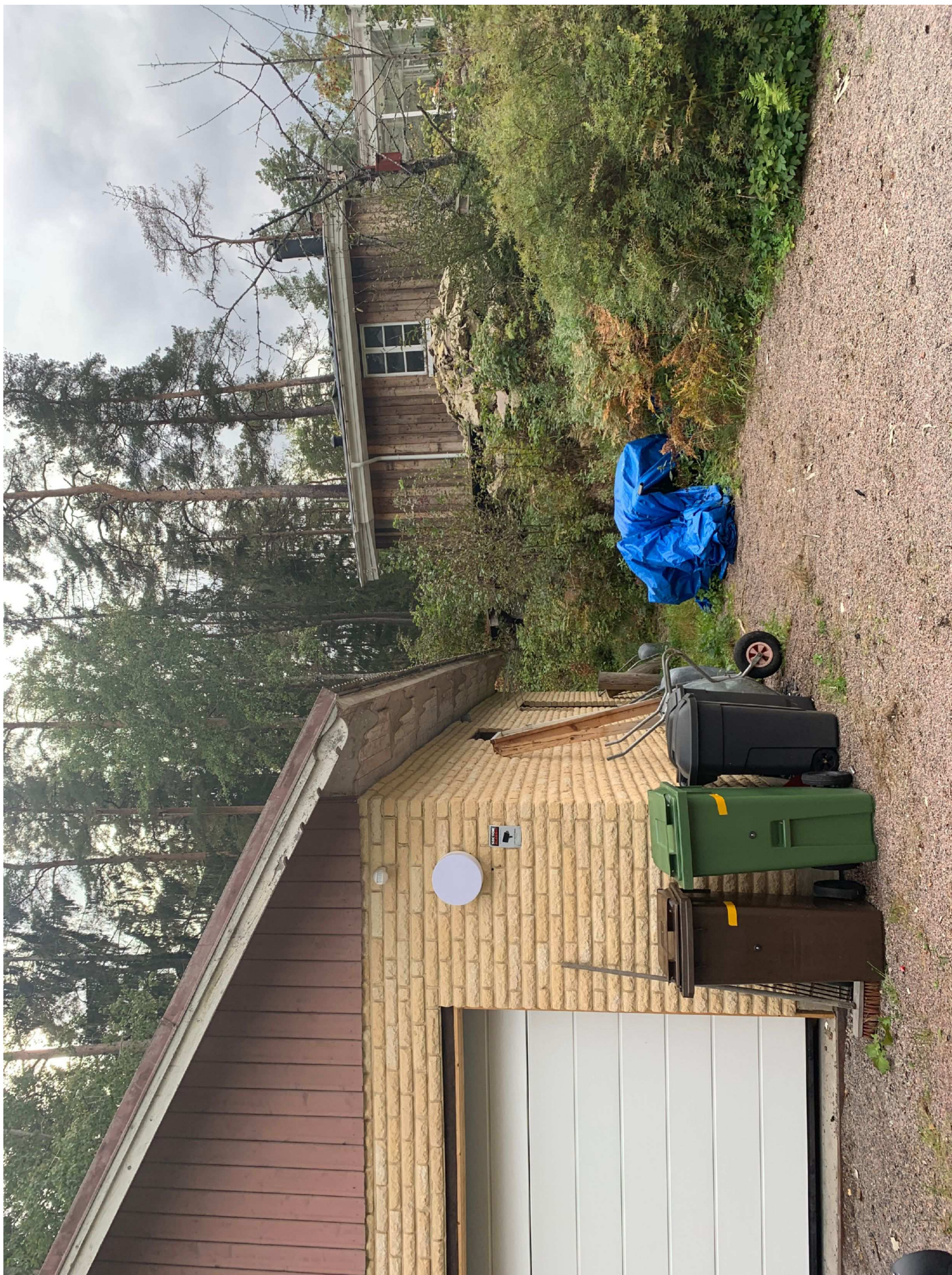
2. Garage, samt uthus med glashus där väska upphittades.