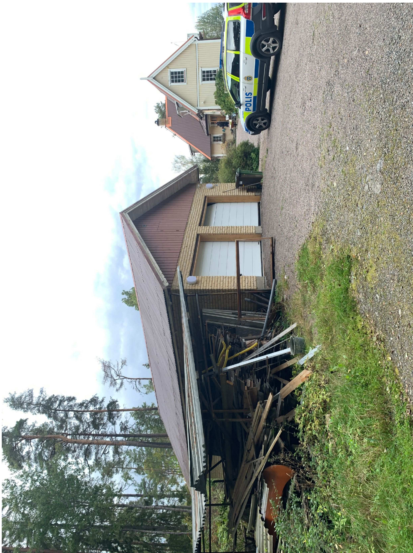
3. Översiktsbild uppfart.