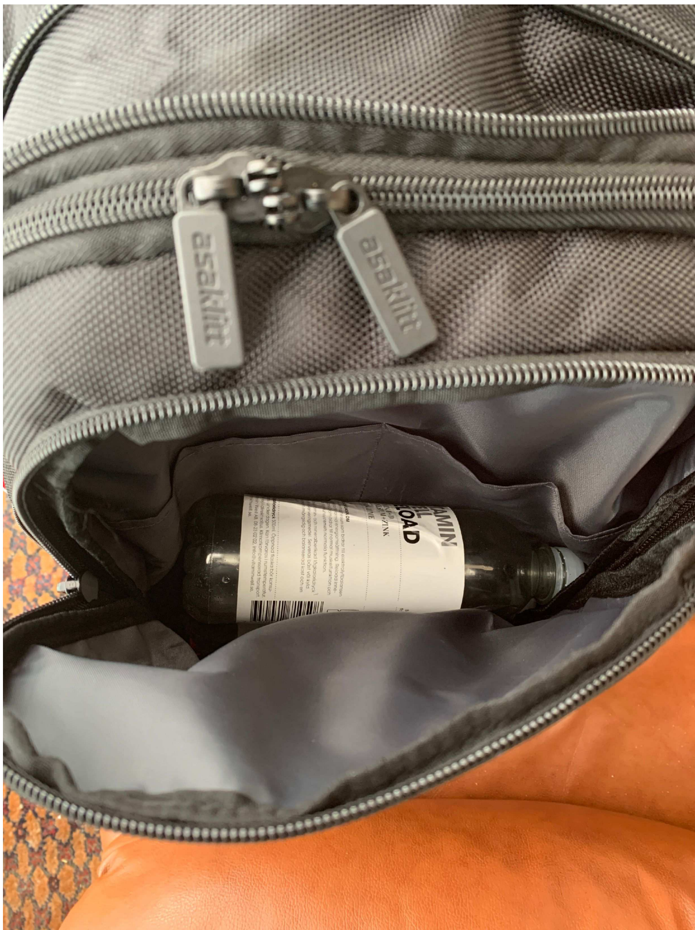
22. Fack 2.