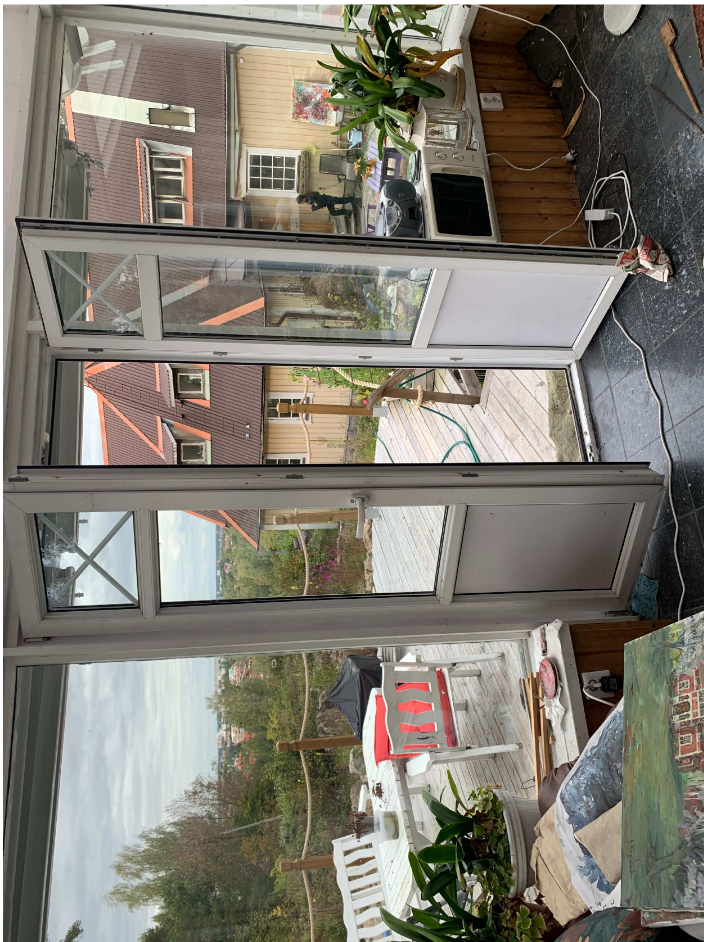
25. Foto innifrån rummet.