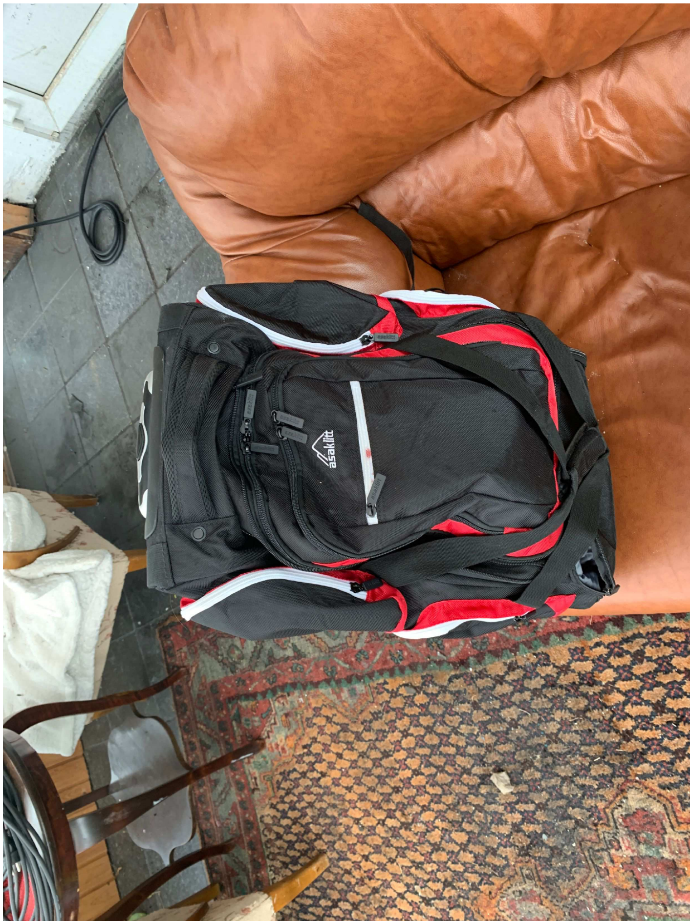
19. framsida av väskan.