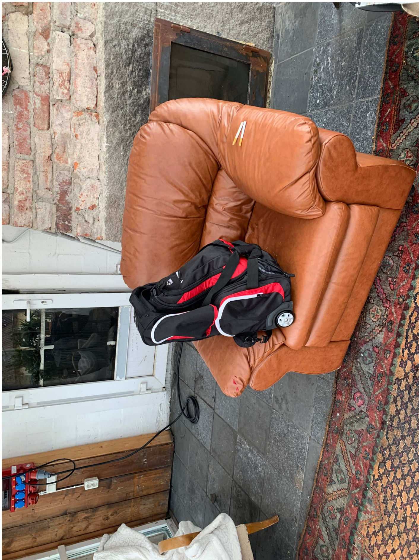
17. Misstänkt väska i fätölj.