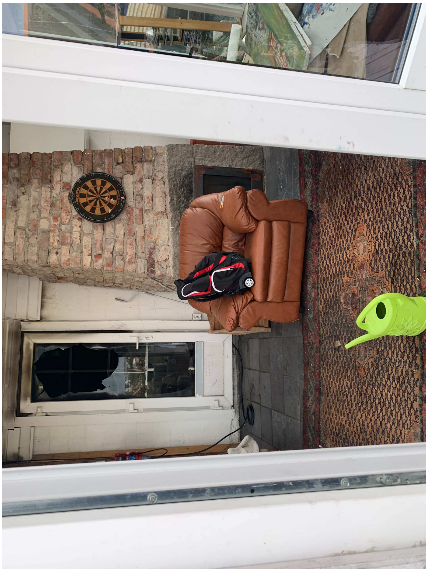
14. Misstänkt väska i fätölj.