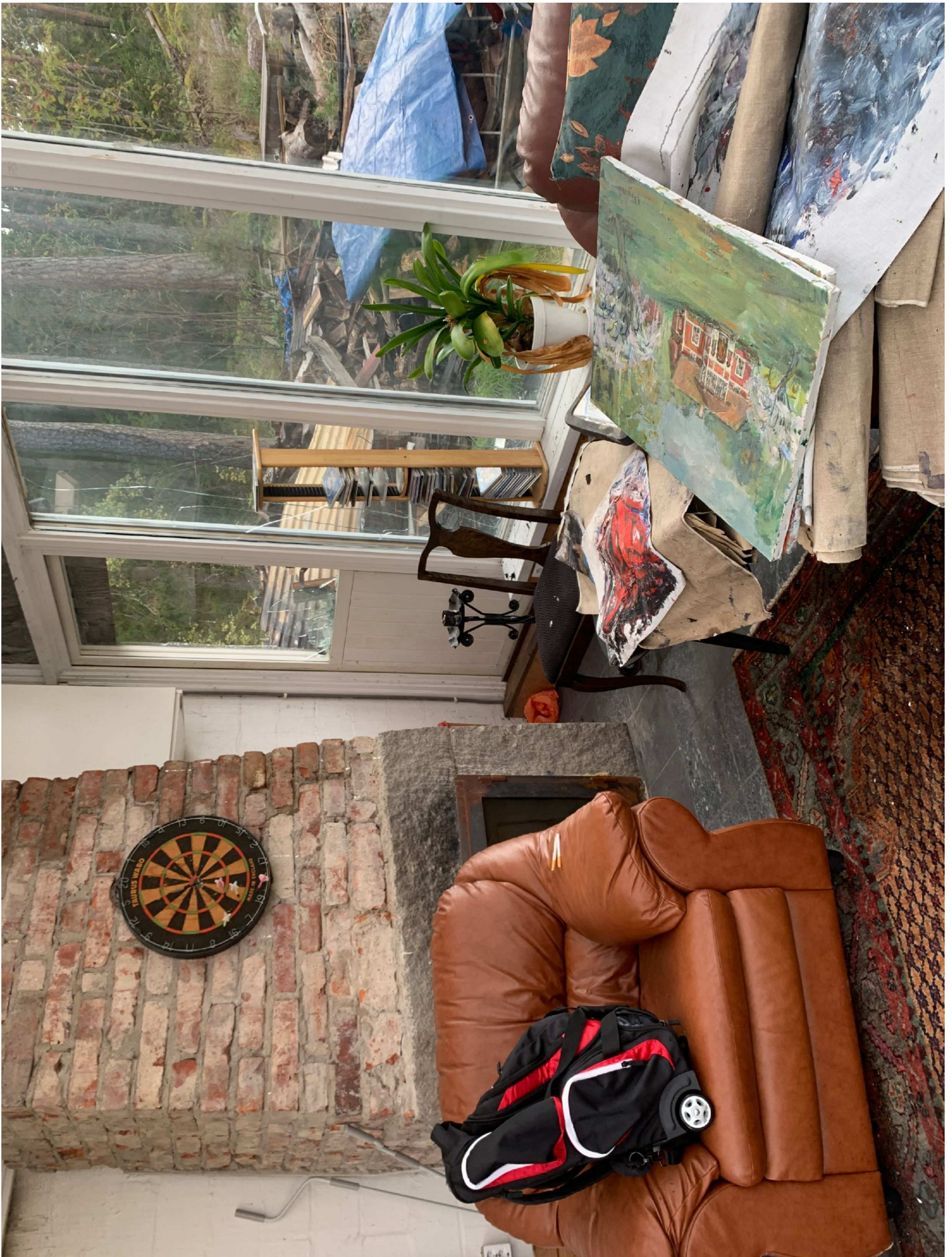
15. Översiktsbild uthus högersida av rummet.