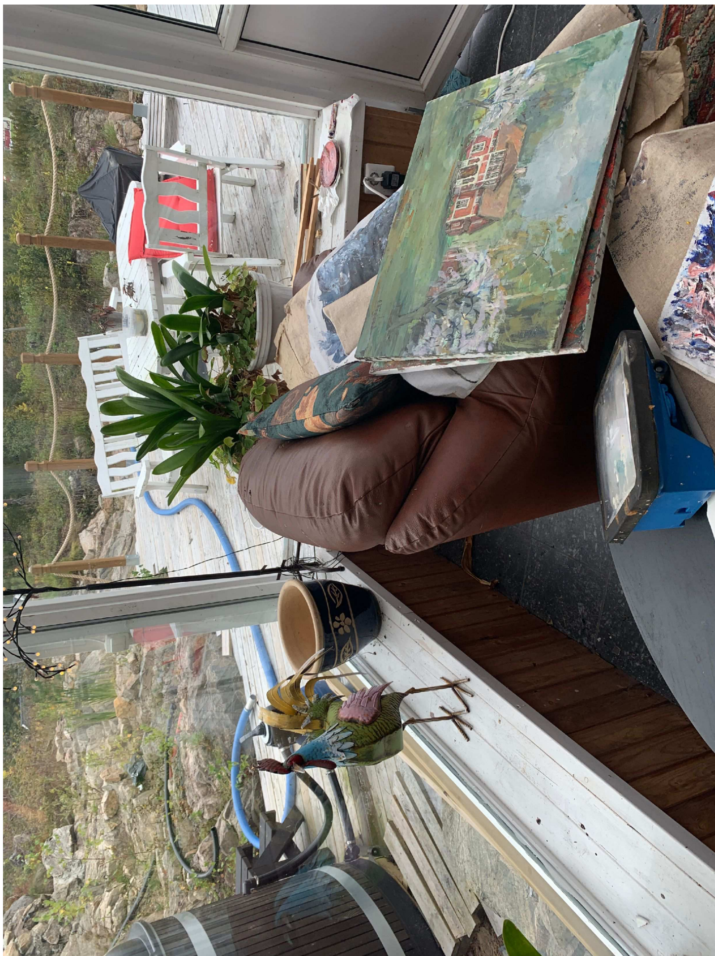
26. Foto inifrån rummet.