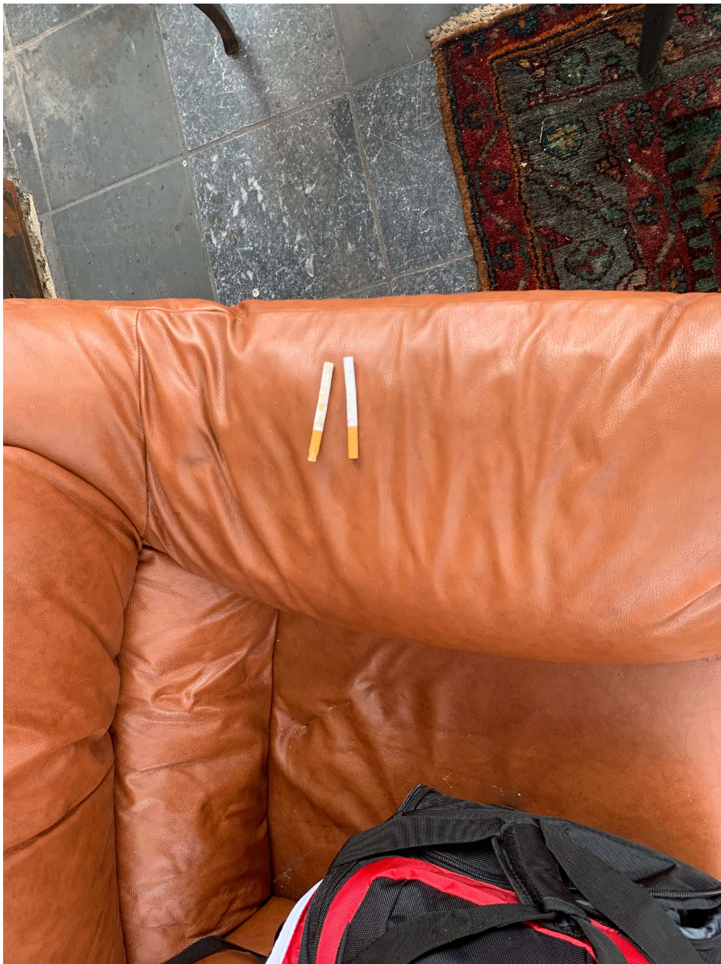
18. Två stycken cigaretter.