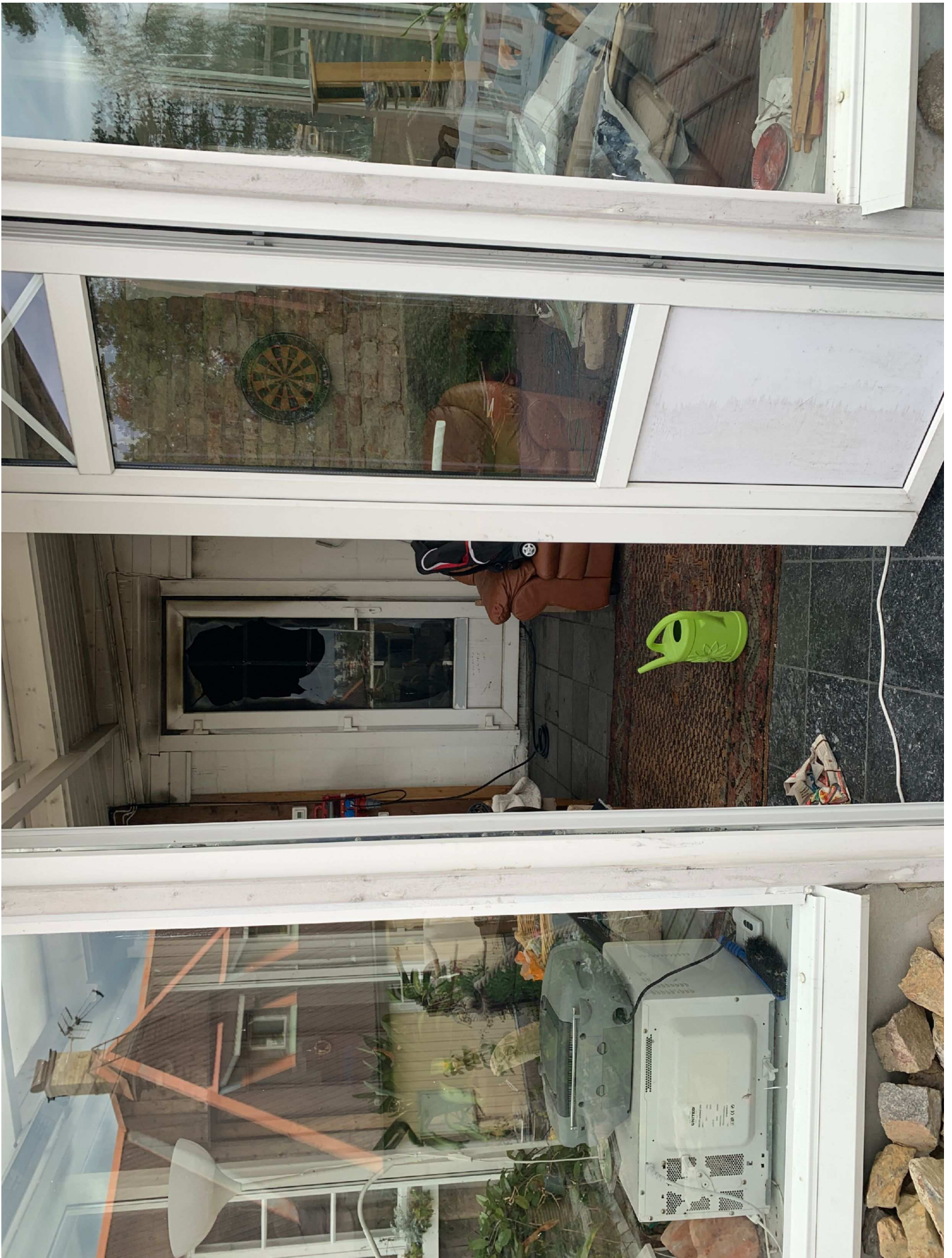
13. Ingång uthus.