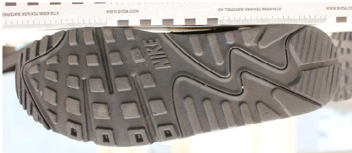
Figur 1. Skosula höger sko, BG142813-1.

Vid jämförelse som gjorts mellan skornas skosulemönster (figur 1) och ett skospår (figur 2) som säkrats i samband med platsundersökningen i den avlidnes lägenhet på Tegnervägen är den initiala bedömningen att mönstertypen är väl överensstämmande.