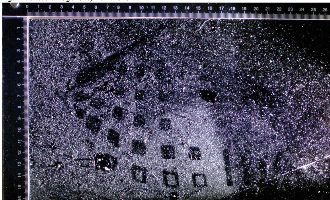
Figur 2. Foto på skospår som säkrats på vardagsrumsgolvet vid platsundersökningen den 13 december 2023.