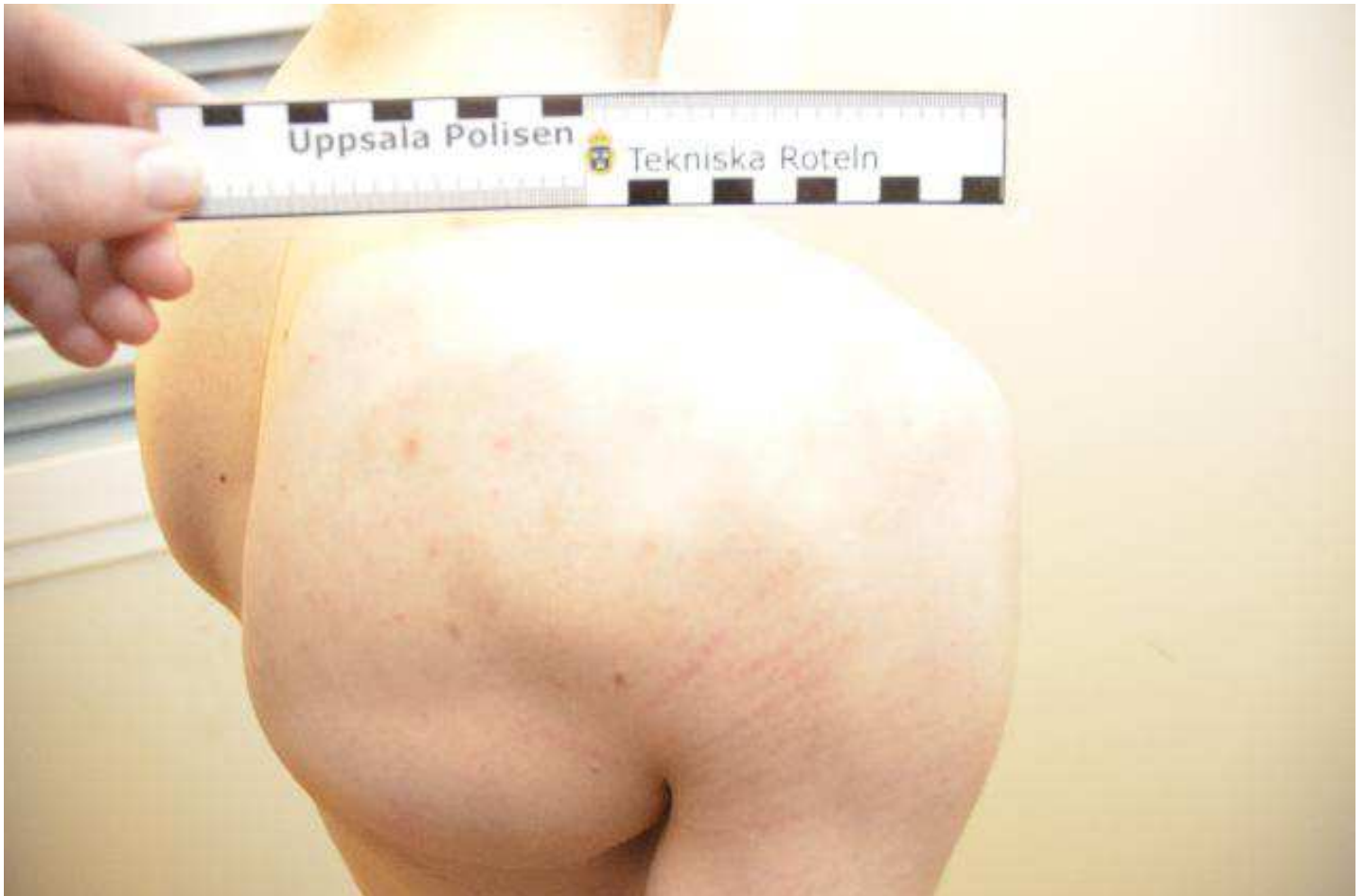
Höger axel riv /skrapmärken.