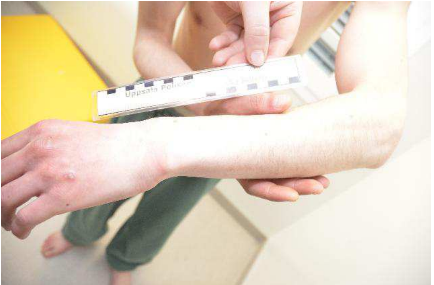
Fahed har mycket ont i sin arm och kan inte röra den. Syns dock inga skador på fotografier.