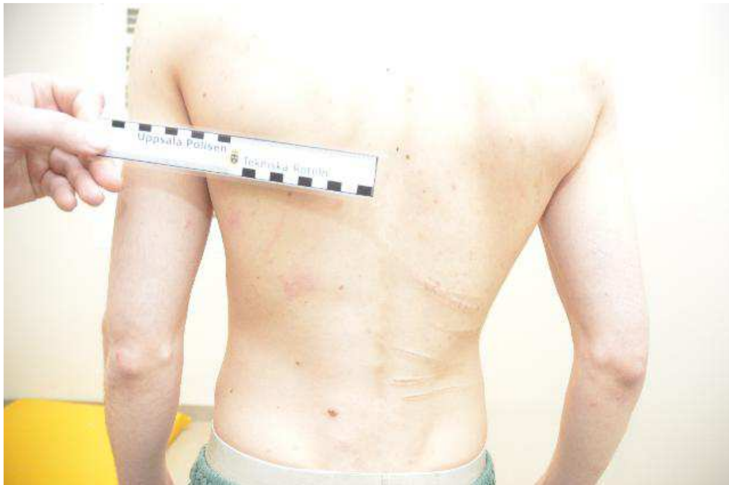
Vänster sida rygg rivmärken. Höger sida gamla skador som han fått i Syrien enligt egen uppgift.