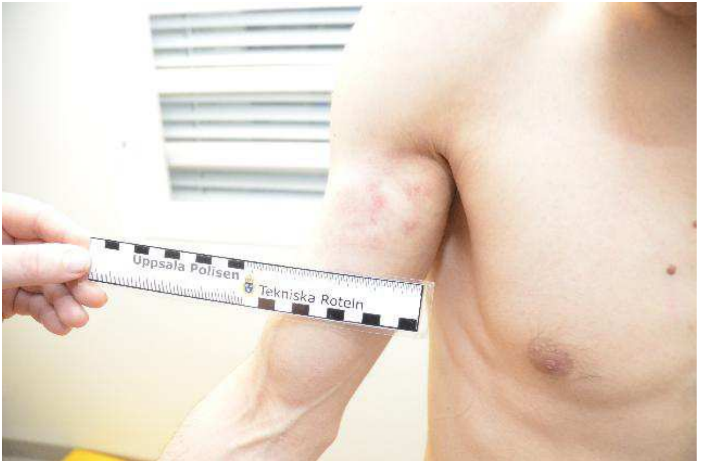
Blåmärke höger överarms insida