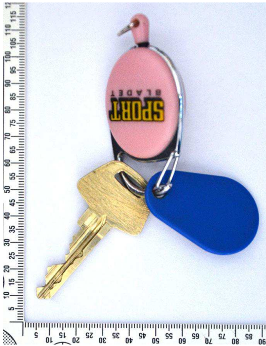
Figur 14. Nyckelknippa, ena sidan.

Topsen S001-S002 har skickats till NFC Halmstad för undersökning.