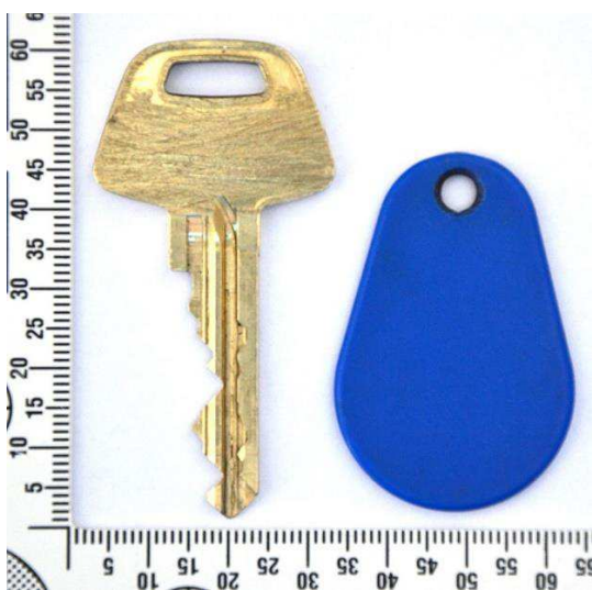
Figur 16. Nyckel och ”tag”, ena sidan.