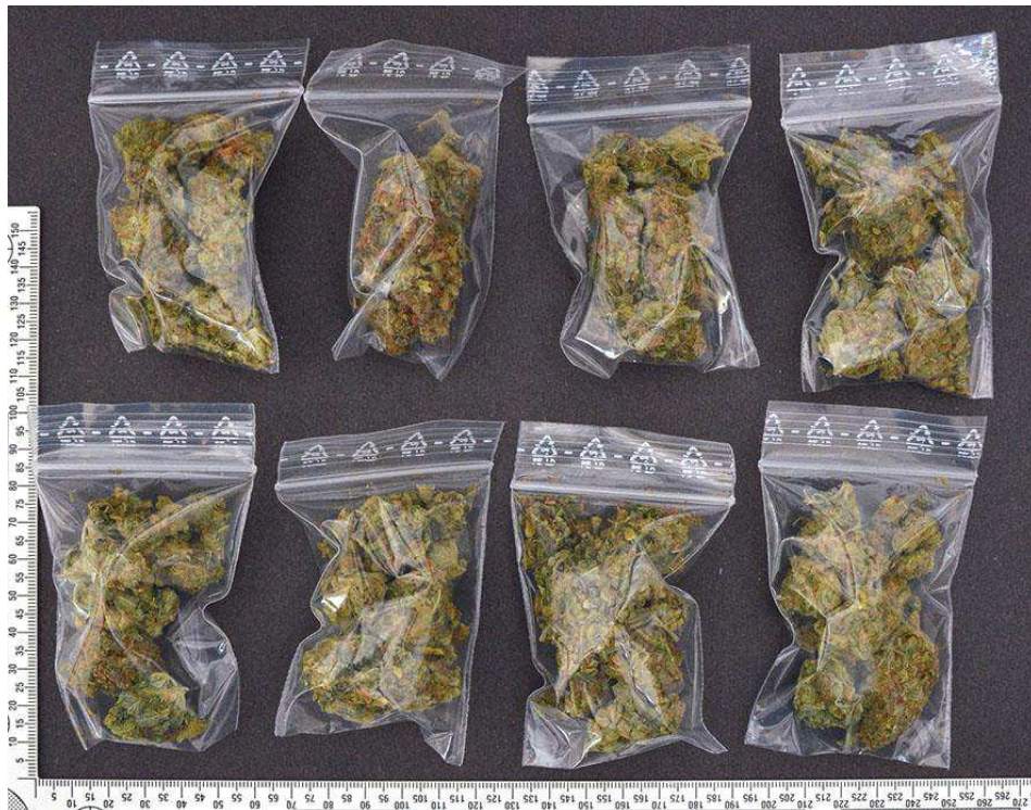
Figur 13. Blixtlåspåsar (G016) med innehåll.

Den knutförsedda plastpåsen (G015) och blixtlåspåsarna (G016) har skickats till NFC Halmstad för undersökning.