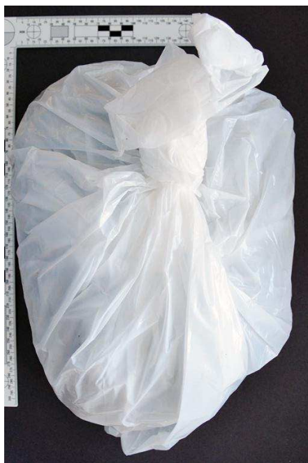
Figur 1. Knutförslutna plastpåsar (G007).

De två knutförslutna plastpåsar (G007) har skickats till NFC Halmstad för undersökning.