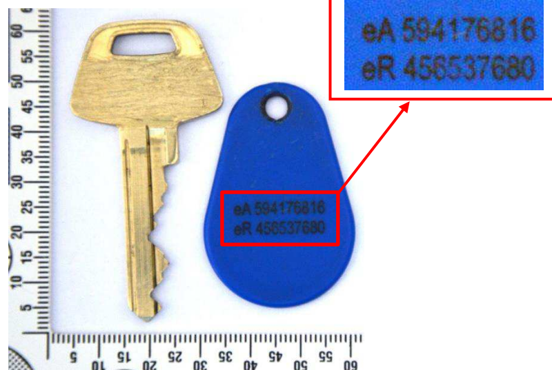
Figur 17. Nyckel och ”tag”, andra sidan.