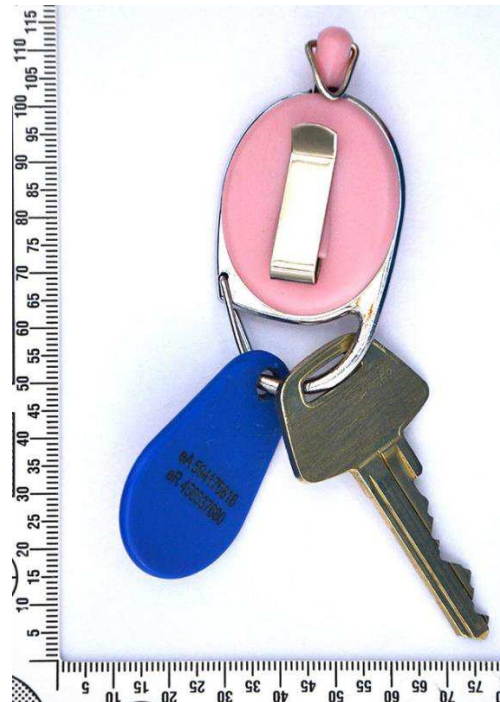
Figur 15. Nyckelknippa, andra sidan.