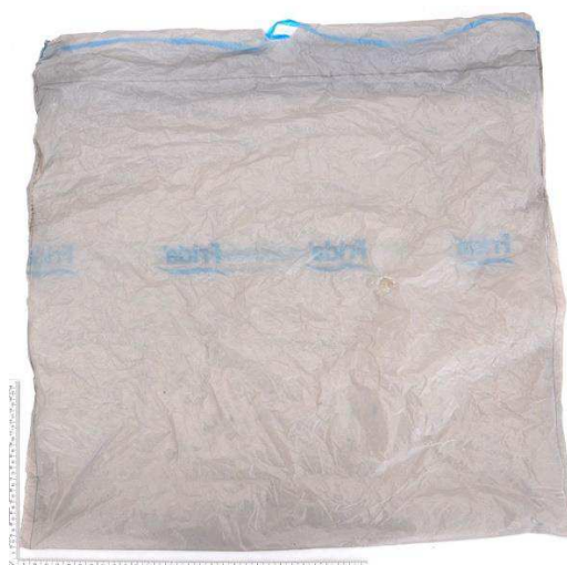
Figur 5. Grå plastpåse, andra sidan.