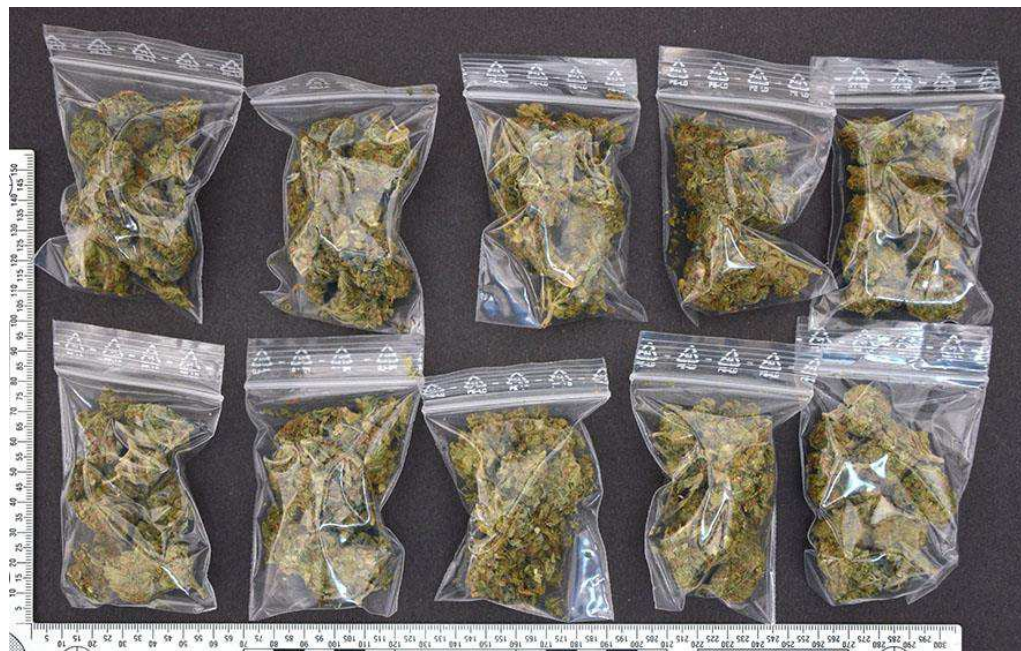
Figur 9. Blixtlåspåsar (G012) med innehåll.

Blixtlåspåsarna storlek var ca 8 x 6 cm. Påsarna var försedda med en vit märkning/text. Blixtlåspåsarna med innehåll vägde från 4,37 gram och upp till 4,64 gram.