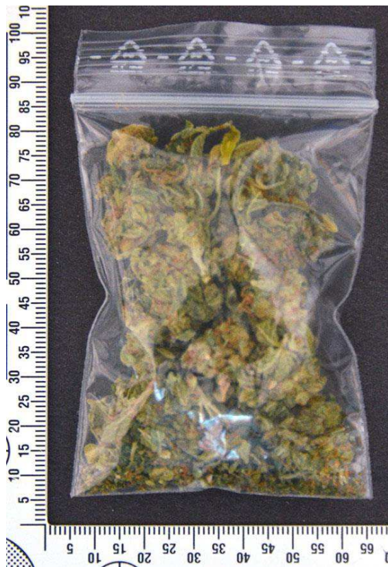
Figur 18. Blixtlåspåse (G017) med innehåll.

Blixtlåspåsen (G017) har skickats till NFC Halmstad för undersökning.