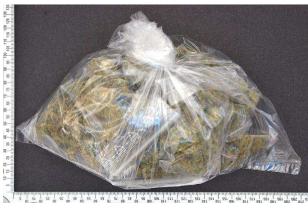
Figur 8. Plastpåse (G011) med innehåll.

En knutförsluten plastpåse (G011) innehållande 10 stycken blixtlåspåsar (G012) med misstänkt narkotika i form av torkade växtdelar (G002).