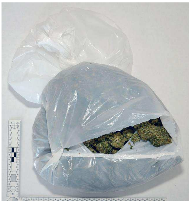
Figur 2. Plastpåsar (G007) innehållande misstänkt narkotika (G001).