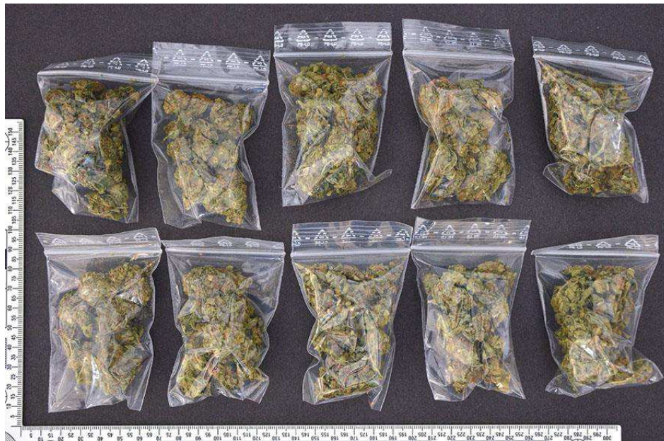
Figur 11. Blixtlåspåsar (G014) med innehåll.

Den knutförsedda plastpåsen (G013) och blixtlåspåsarna (G014) har skickats till NFC Halmstad för undersökning.