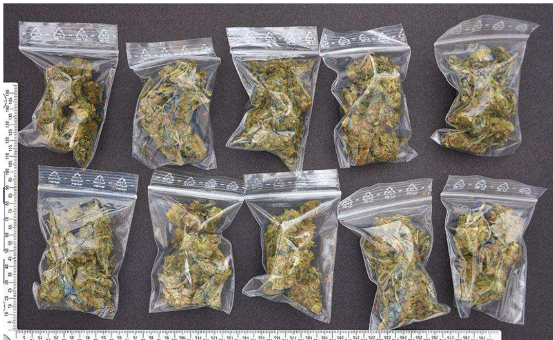
Figur 7. Blixtlåspåsar (G010) med innehåll.

Blixtlåspåsarna storlek var ca 8 x 6 cm. Påsarna var försedda med en vit märkning/text. Blixtlåspåsarna med innehåll vägde från 4,16 gram och upp till 4,67 gram.