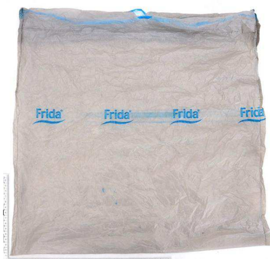
Figur 4. Grå plastpåse (G008), ena sidan.